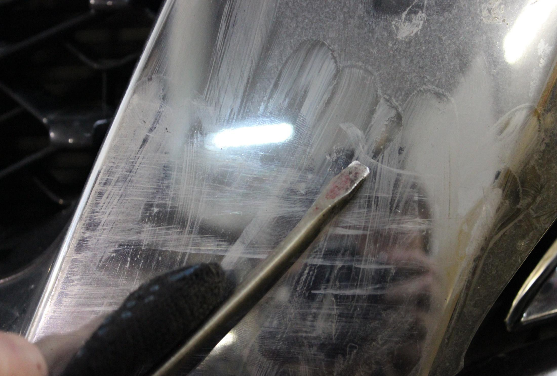
Глубокие царапины на накладке решетки радиатора