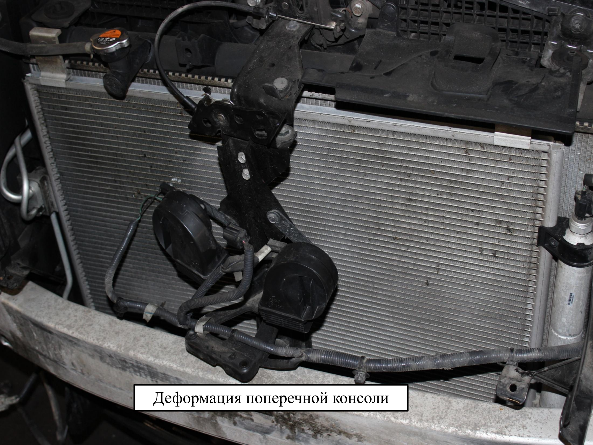
Деформация поперечной консоли