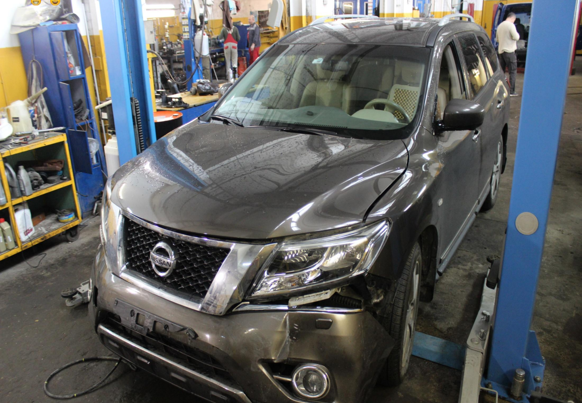
Автомобиль получил удар в переднюю часть!