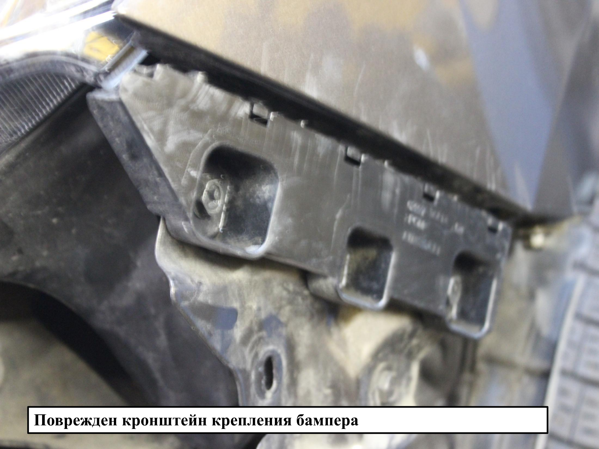
Поврежден кронштейн крепления бампера