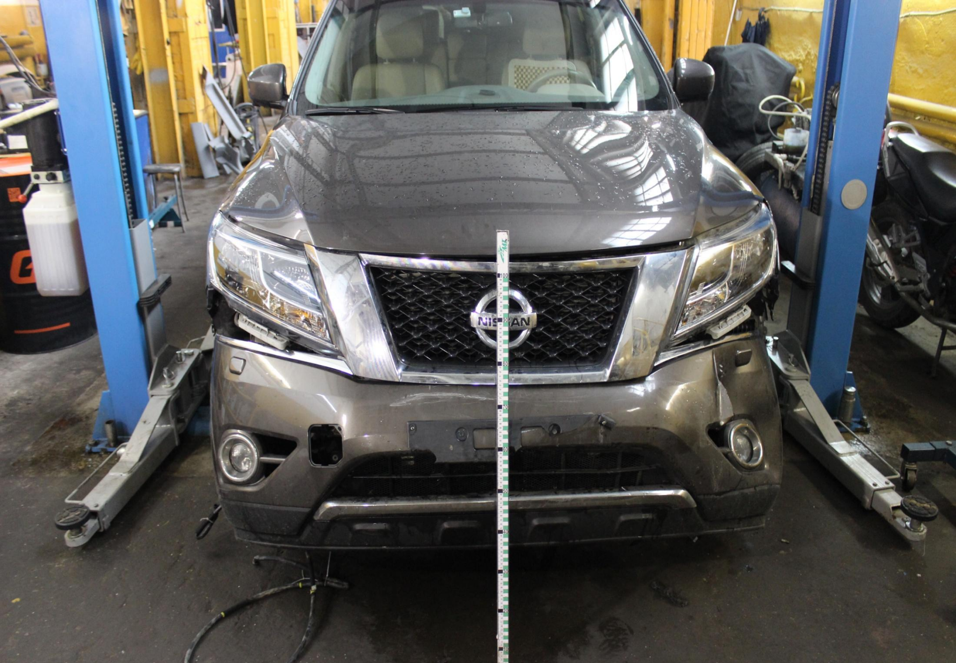
От удара произошло смещение передней панели в правую сторону