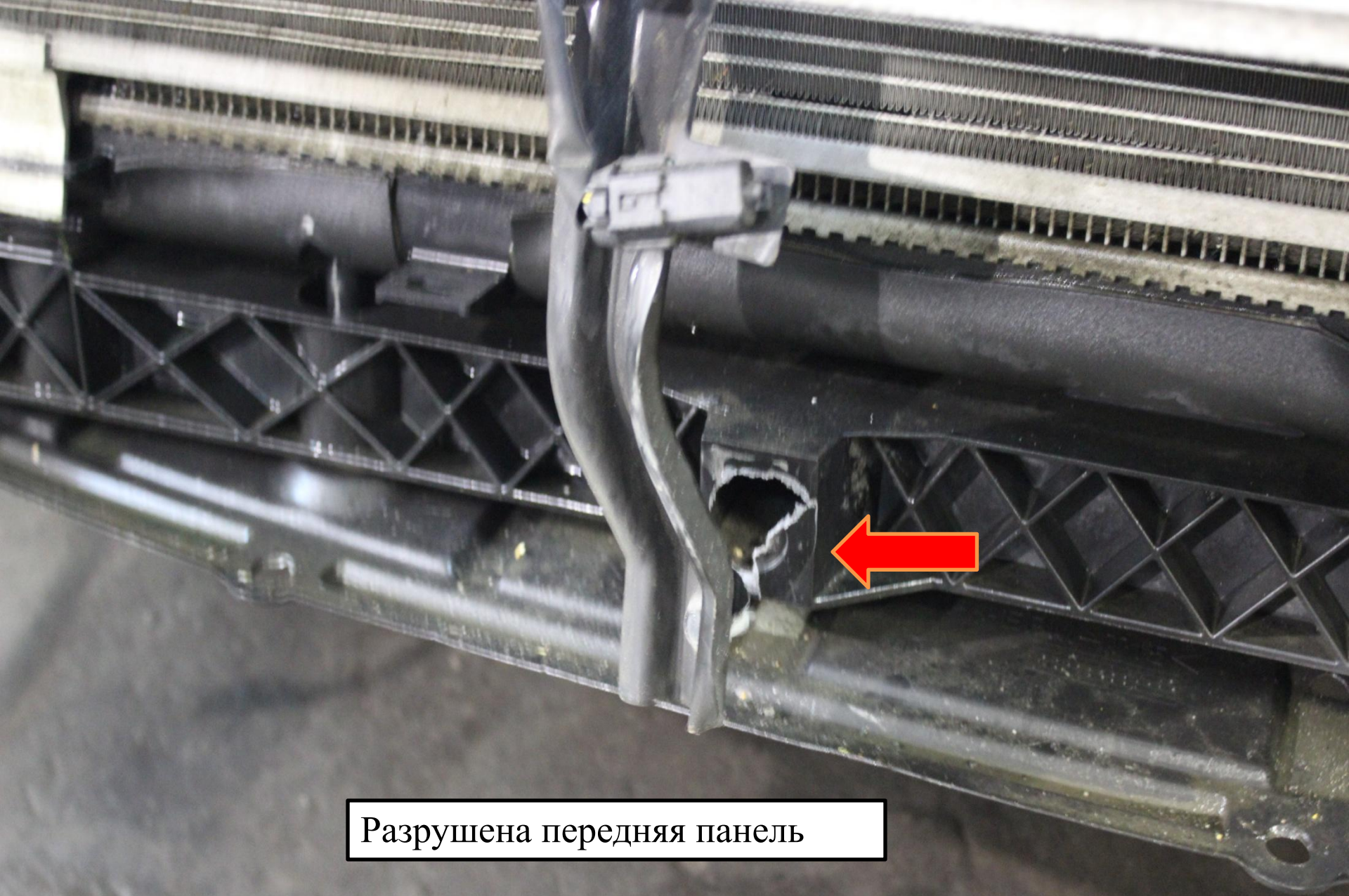
Разрушена передняя панель