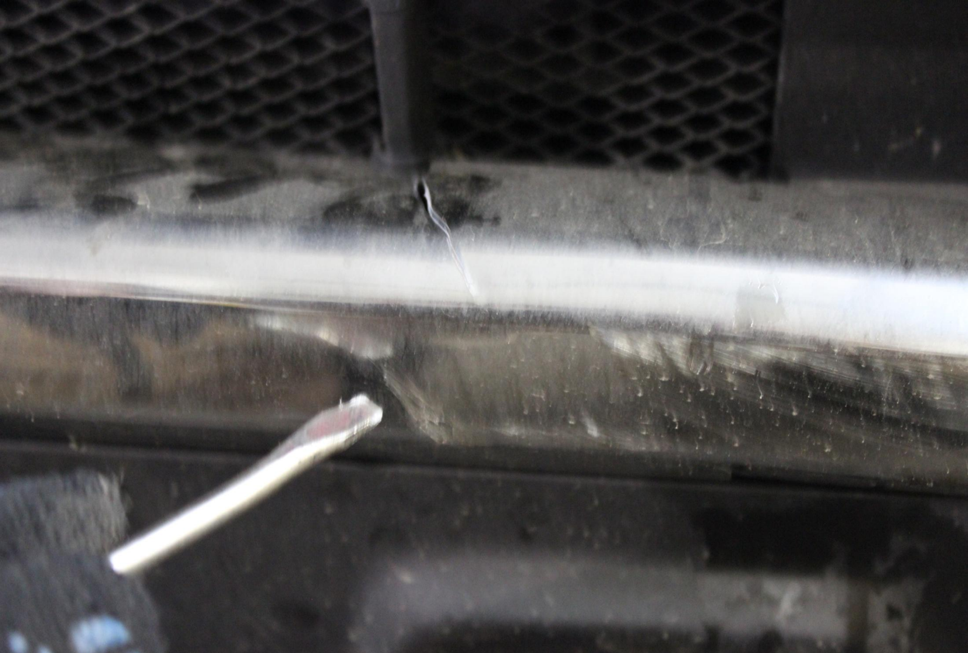
Трещина в нижней облицовке