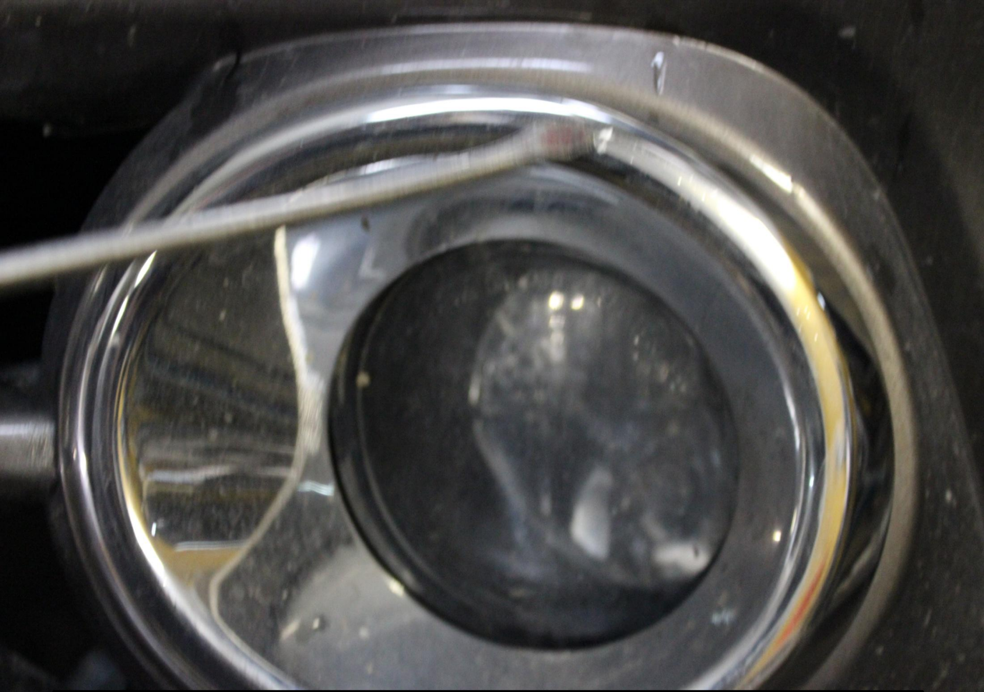
Глубокие царапины на облицовке ПТФ