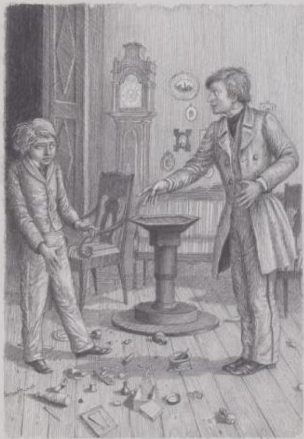
ОТРОЧЕСТВО ГЛАВА V. СТАРШИЙ БРАТ.