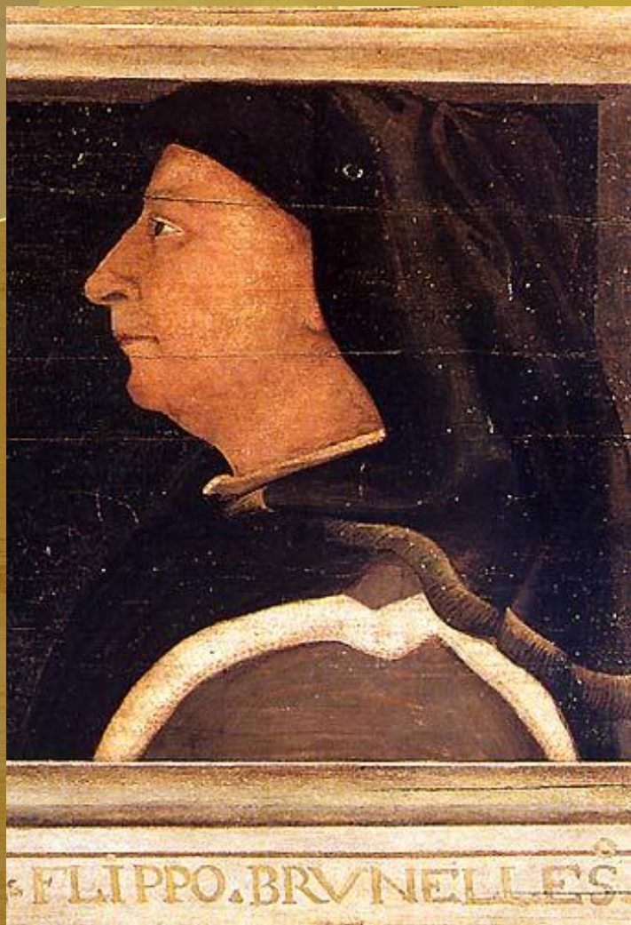
Филиппо Брунелески 1377 - 1446