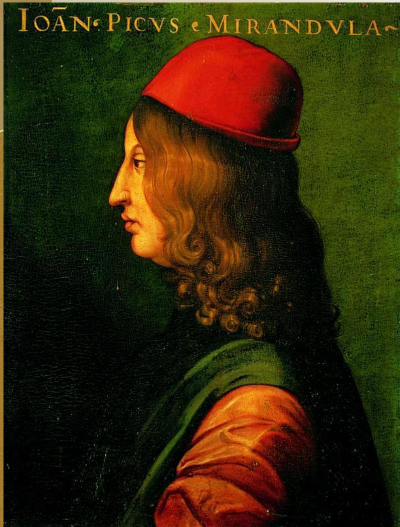
Пико делла Мирандола, гуманист XV века

«Я ставлю тебя в центр Вселенной, чтобы тебе было удобно обозревать всё, что делается в мире».