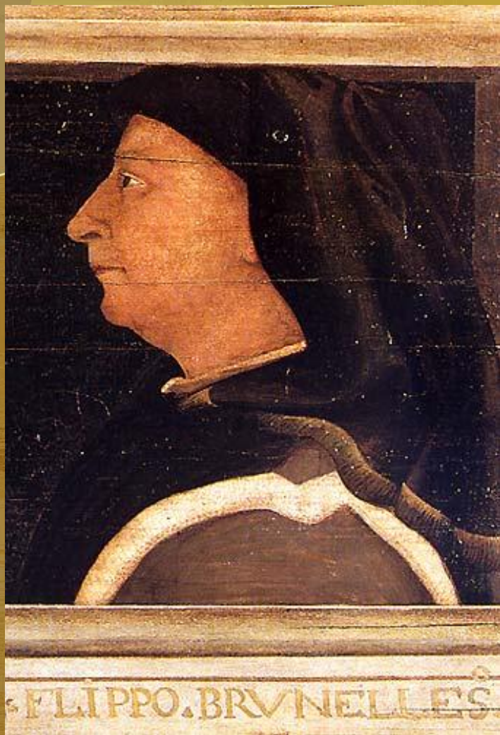
Филиппо Брунелески 1377 - 1446