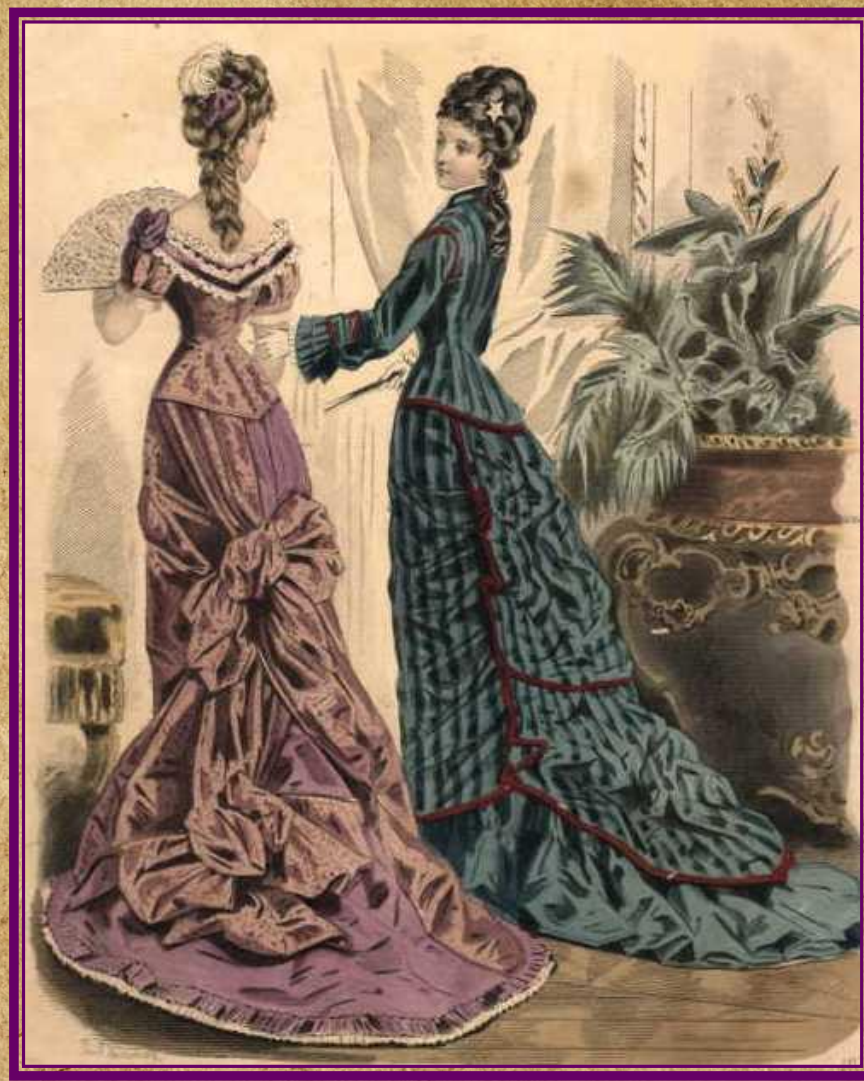
Платья с шлейфом