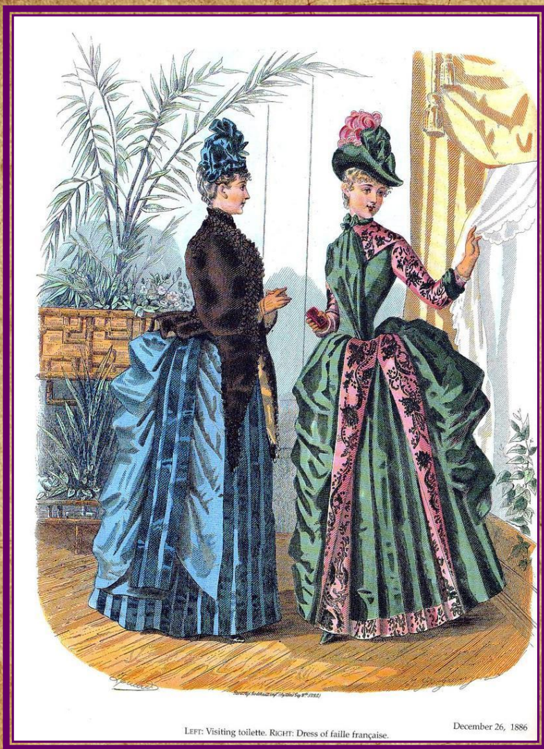
Платья с турнюром