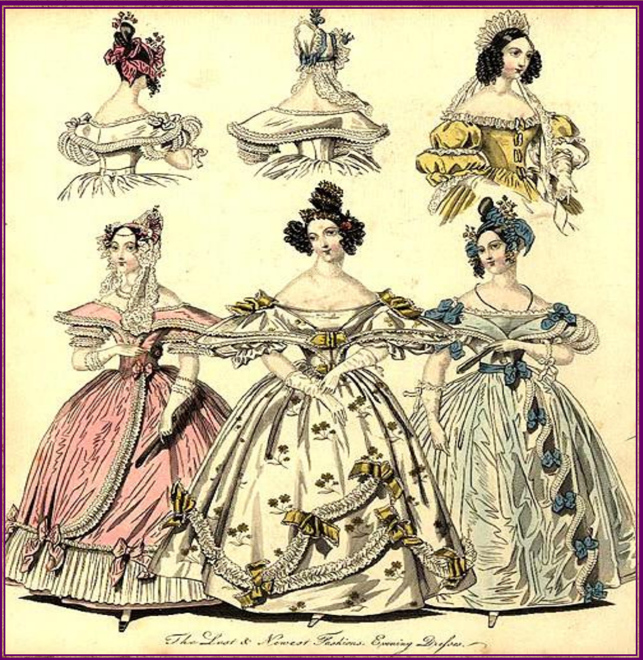
The Last & Newest Fashions. Evening Dresses.