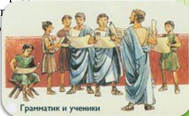
Грамматик и ученики

следил от разного рода опасностей. Педагогом, что (paidago