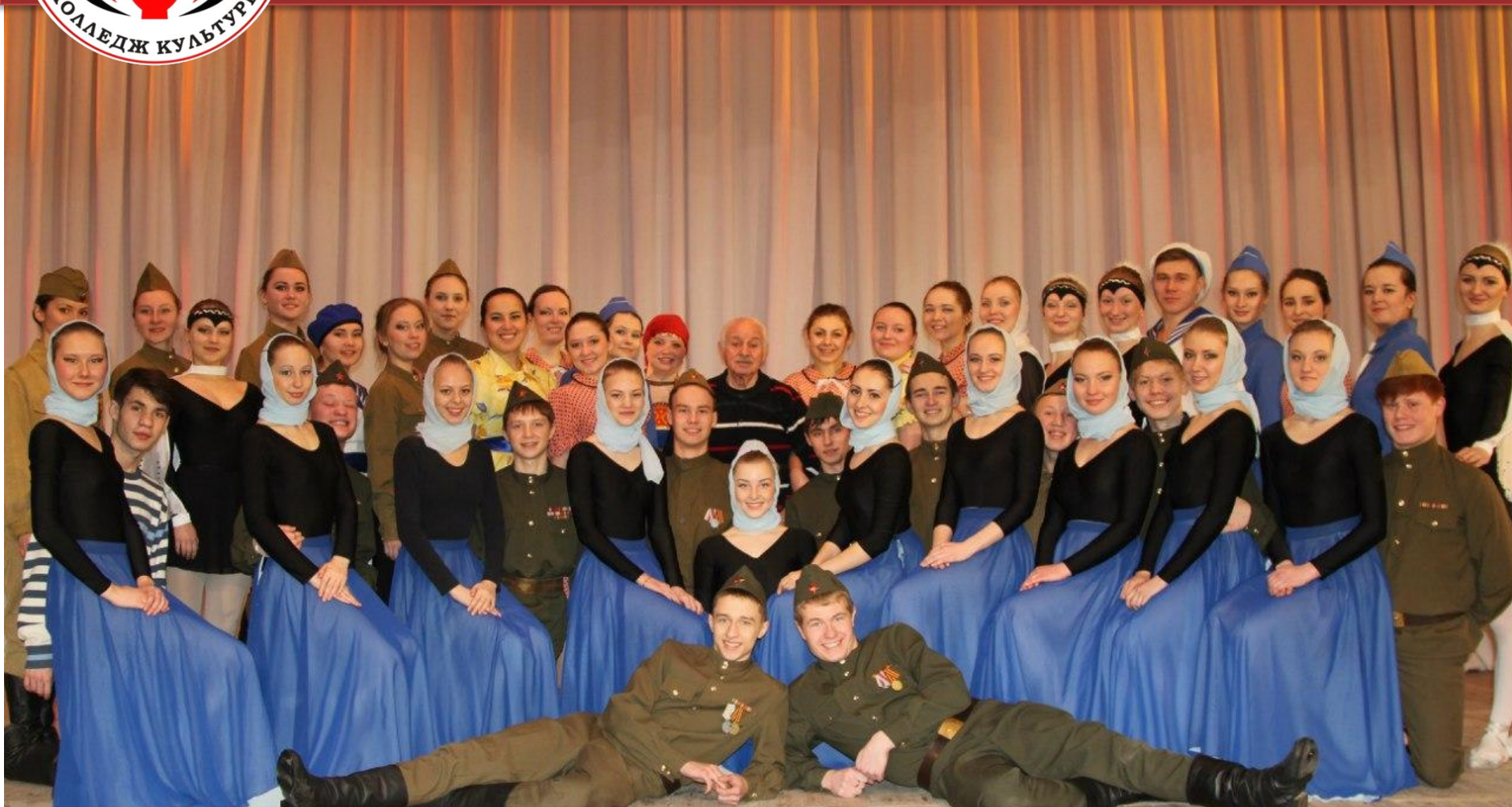
Народный ансамбль песни и танца «Зангари»