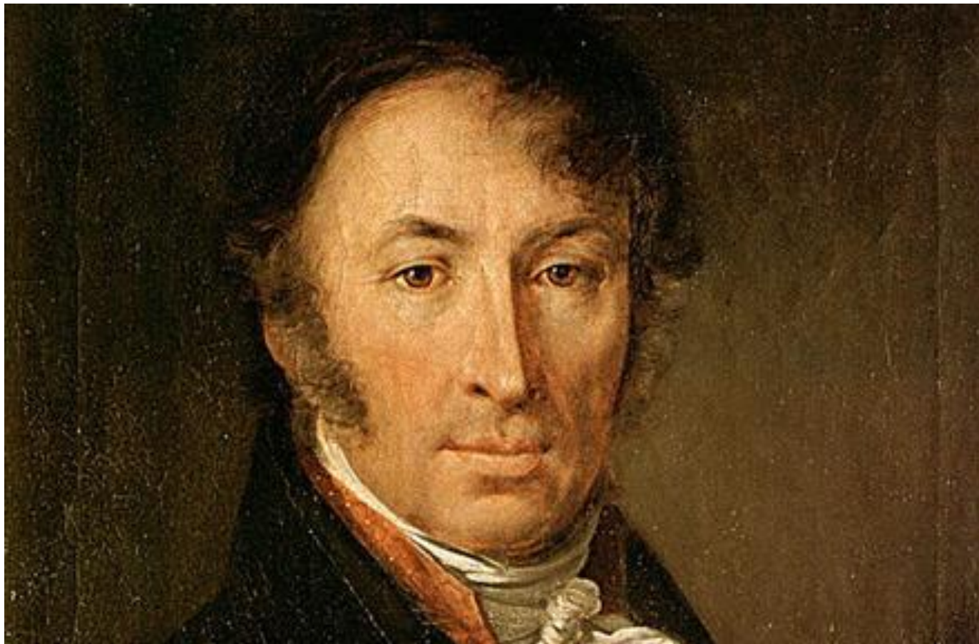
Николай Михайлович Карамзин