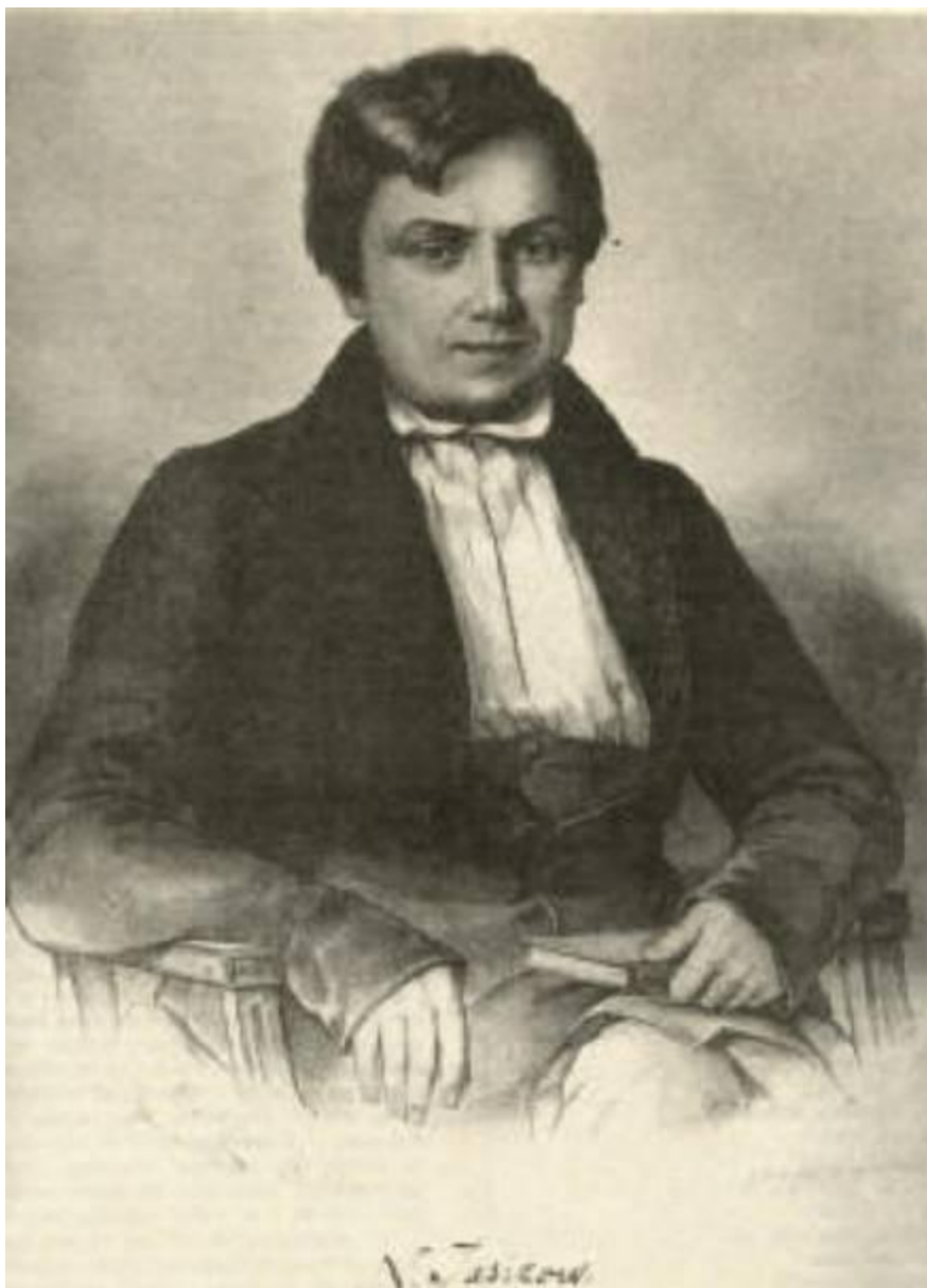
Николай Михайлович Языков