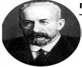
Председатель и мвд – князь Г. Львов

2 марта – Временное правительство России