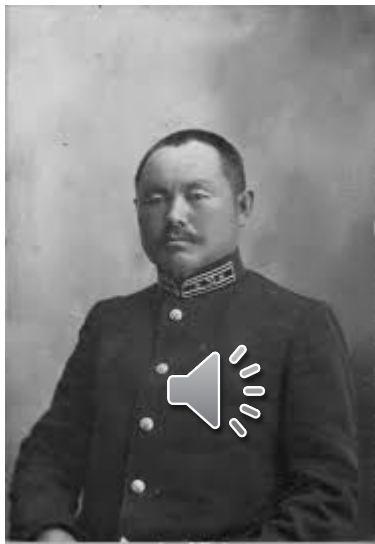
Мухамеджан Тынышпаев Семиреченской области