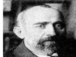
Чхеидзе К. меньшевик