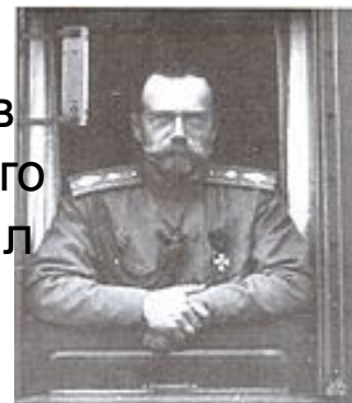
Акт об отречении Императора Николая II. 2 марта 1917 г. (ГА РФ)

2 марта 1917 года император Николай II принял решение отречься от престола в пользу младшего родного брата великого князя Михаила Александровича. Михаил Александрович не рискнул вступить на престол, так как не располагал никакой реальной силой. Монархия пала