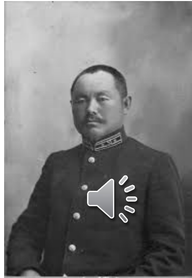
Мухамеджан Тынышпаев Семиреченской области