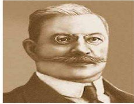
мид П. Миллюков кадет