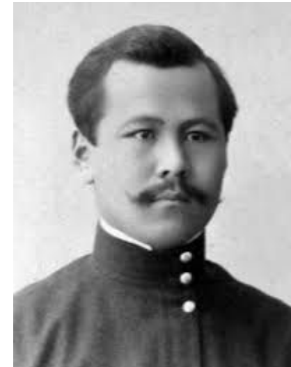
Мустафа Шокай Туркестане