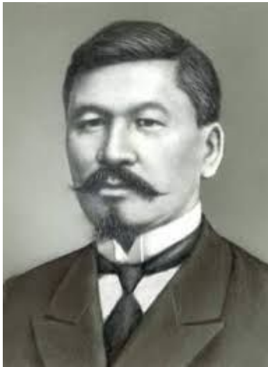
Алихан Букейханов Тургайской области