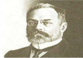
военный и морской министр А. Гучков октябрист

27 февраля – создан Петроградский Совет рабочих и солдатских депутатов