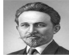
Скобелев М. меньшевик

27 февраля – создан Петроградский Совет рабочих и солдатских депутатов