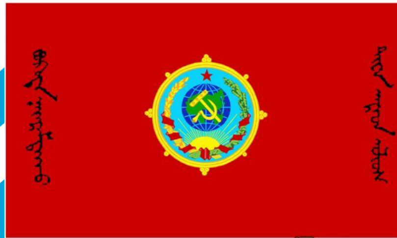
Флаг Тувы, 1936-1941 гг.