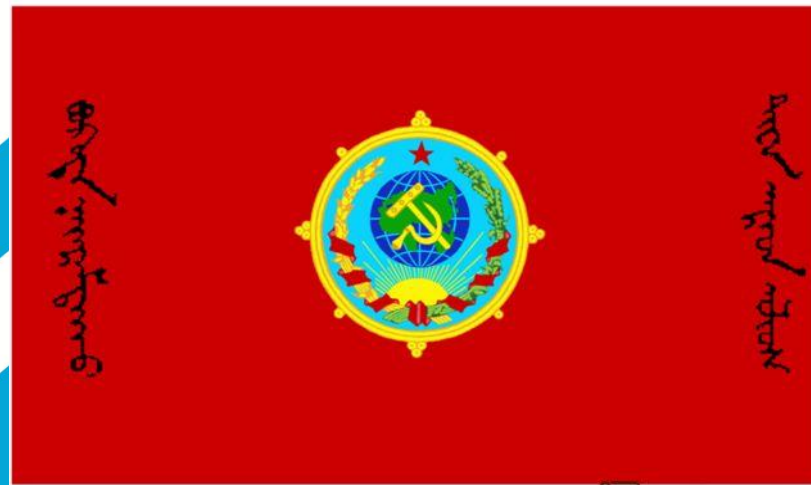
Флаг Тувы, 1936-1941 гг.