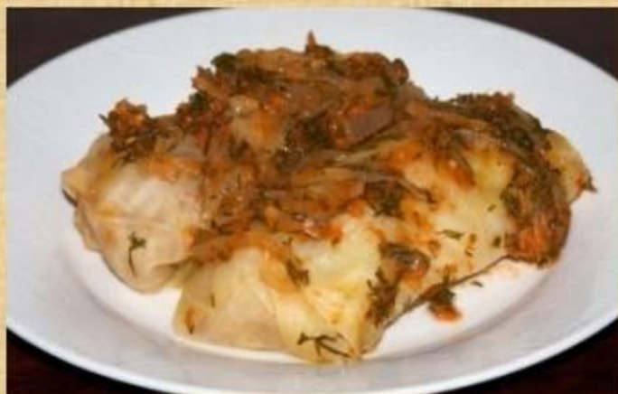
Голубцы с мясом