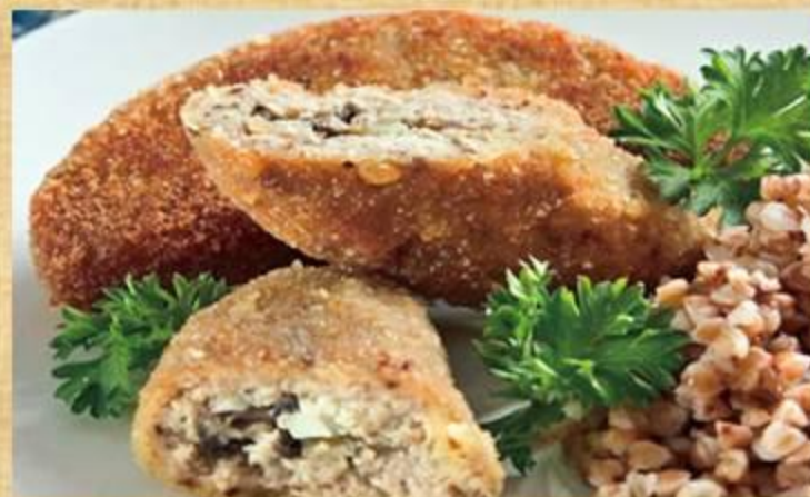
Сиченики из рыбы