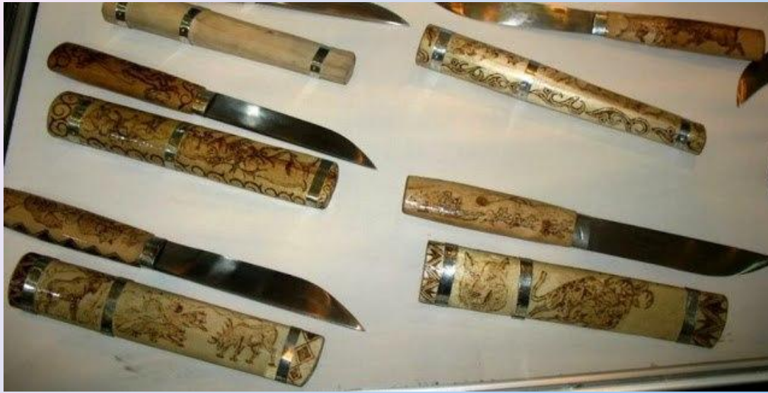
Паренские ножи коряков

Трубка. Моржовой клык. Объемная резьба. Цветная гравировка