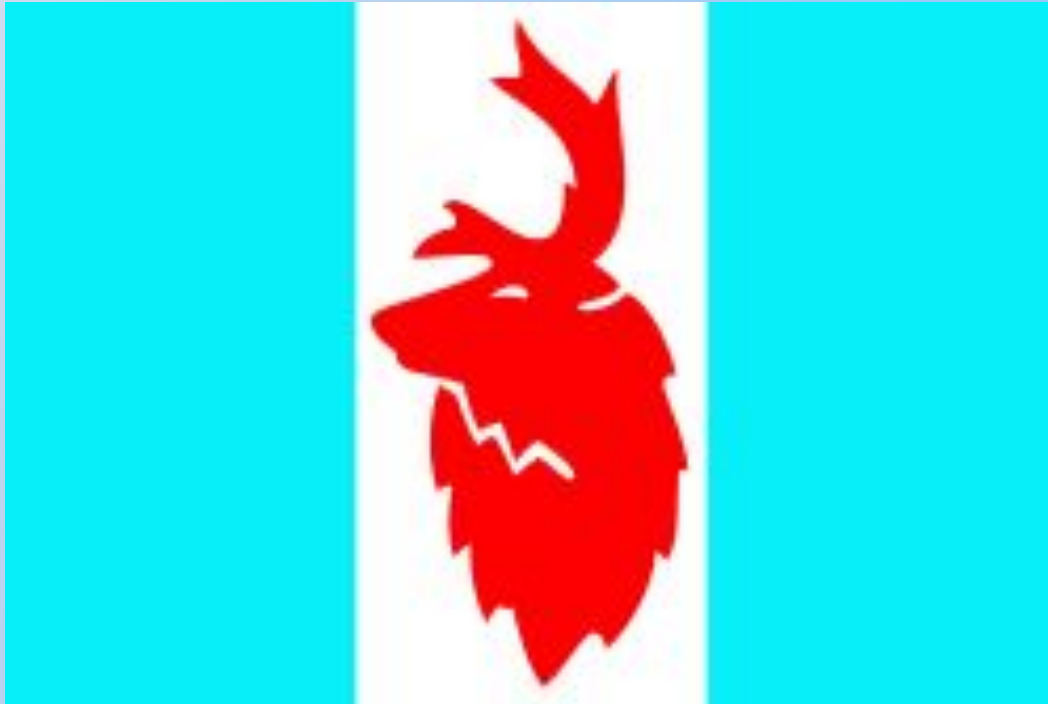
Флаг Корякского автономного округа