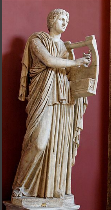
Эрато — муза любовных песен. Атрибут: кифара.