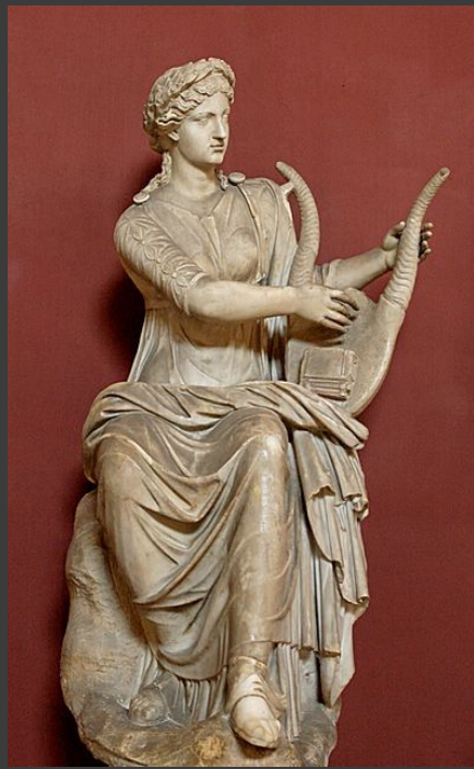
Терпсихора — муза танца. Атрибут: лира.