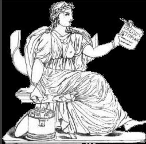
Клио́ — муза истории. Атрибут: свиток.