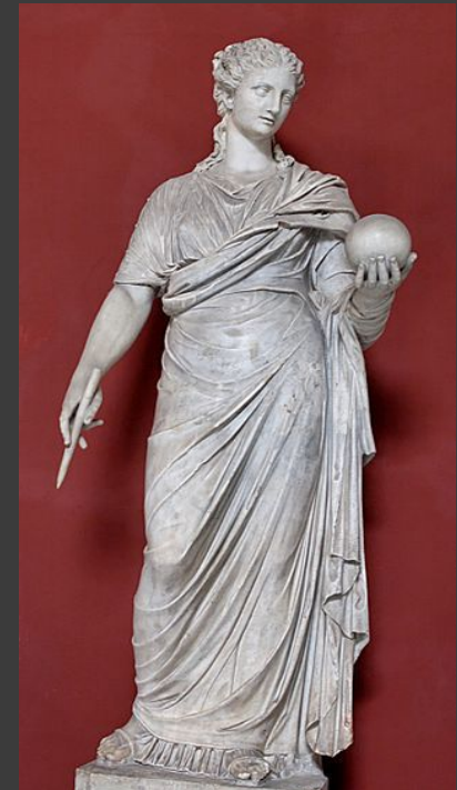
Урания — муза астрономии. Атрибут: небесный глобус и циркуль.