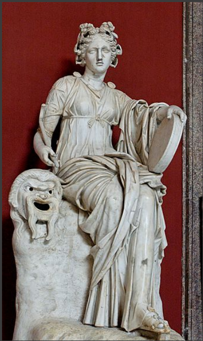
Талия — муза комедии. Атрибут: комическая маска.