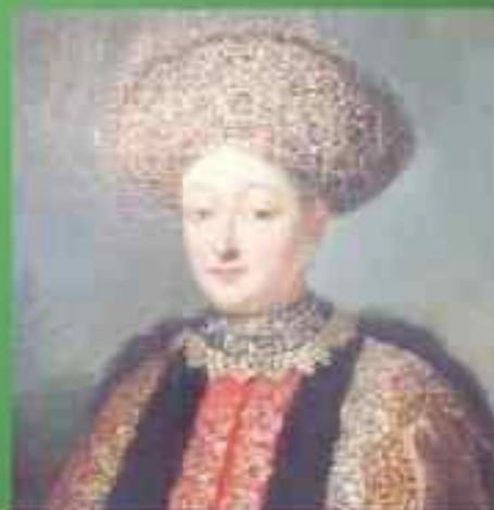
Марфа Матвеевна Апраксина