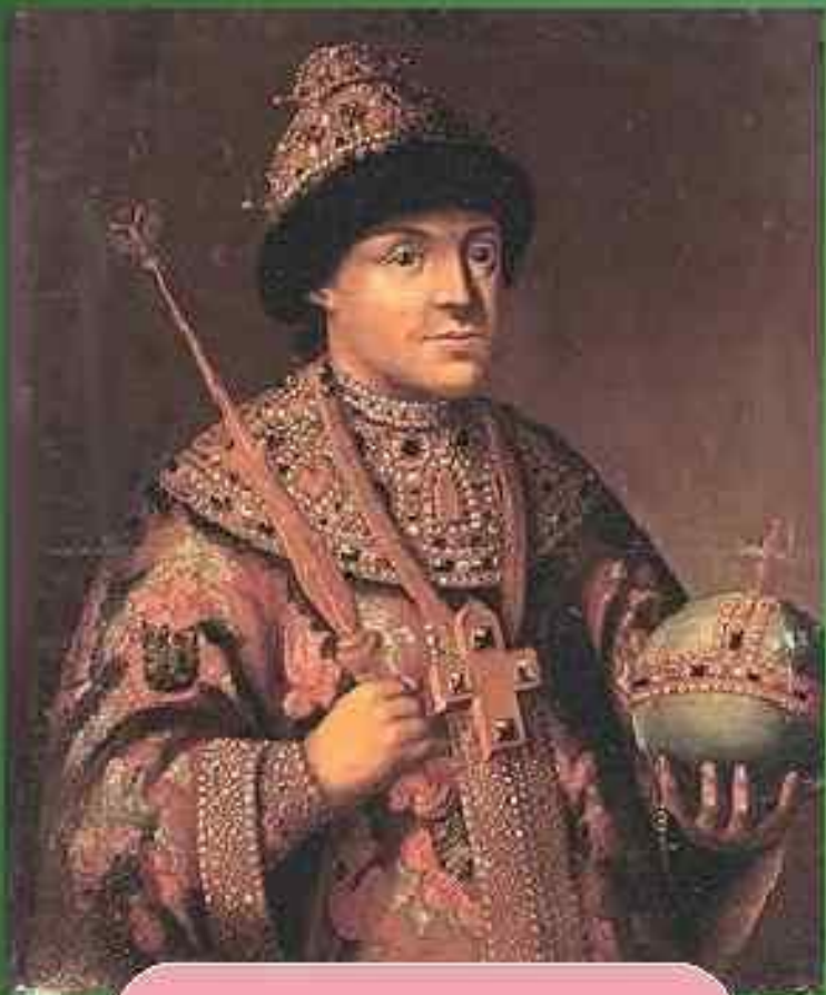
Фёдор Романов 1676-1682 гг.