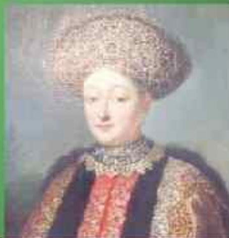
Марфа Матвеевна Апраксина