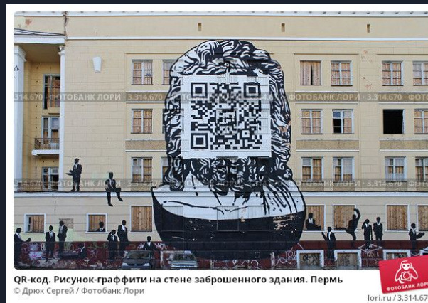
QR-код. Рисунок-графити на стене заброшенного здания. Пермь