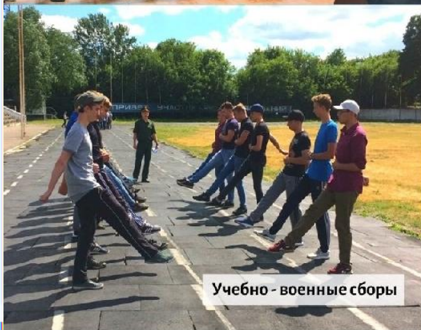
Учебно - военные сборы