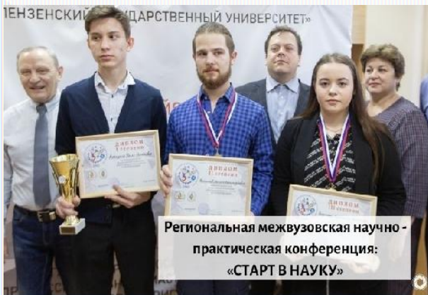
Региональная межвузовская научно-практическая конференция: «СТАРТ В НАУКУ»