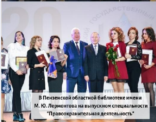
В Пензенской областной библиотеке имени М. Ю. Лермонтова на выпускном специальности "Правоохранительная деятельность"