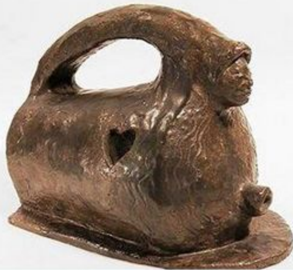
Утюг Испания 1650