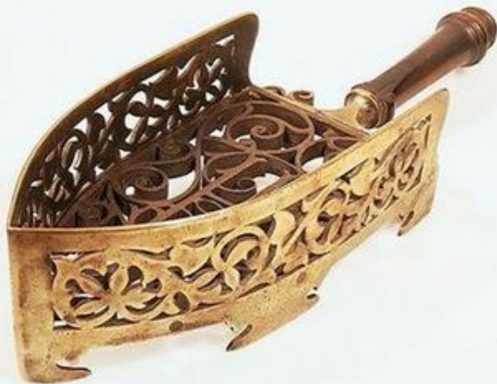
Подставка под утюг 1740