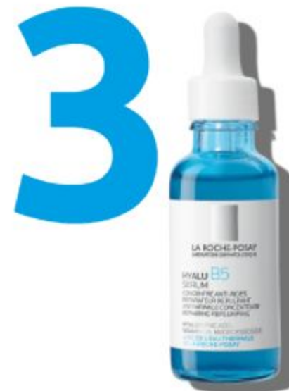
HYALU B5 СИРОВАТКА