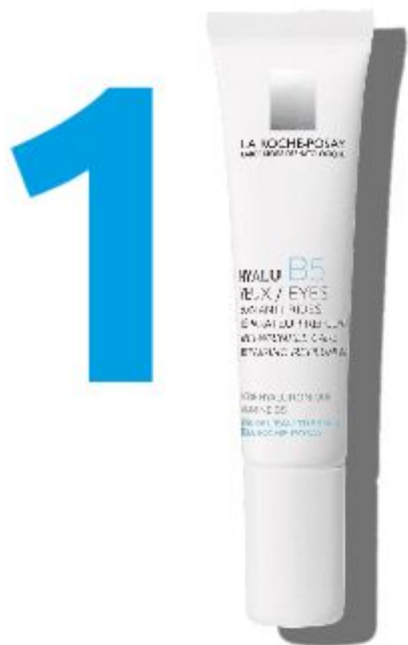
HYALU B5 КРЕМ ДЛЯ ШКИРИ НАВКОЛО ОЧЕЙ