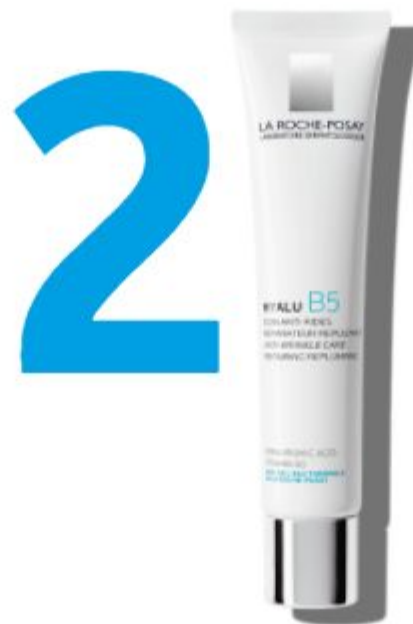
HYALU B5 КРЕМ