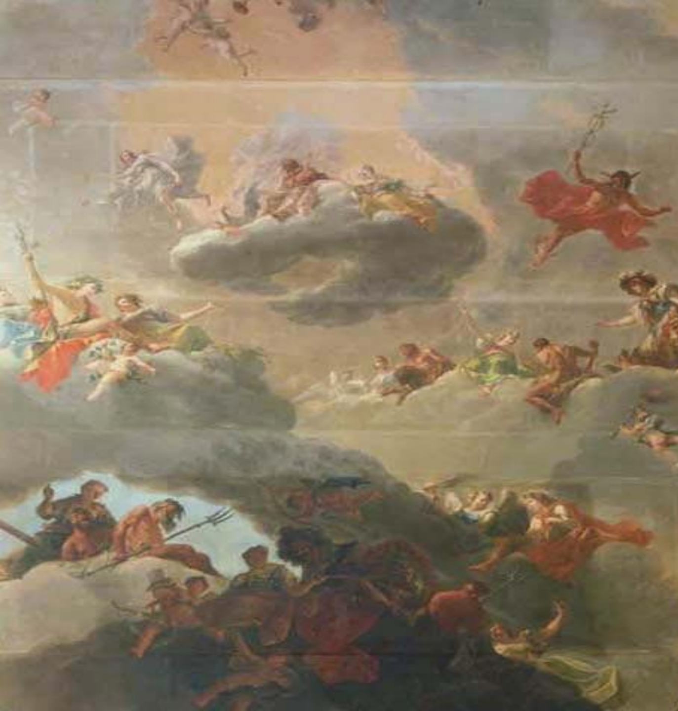
Репро- дукция картины Гаспаро Дициа- ни «Олимп» (фрагмент)