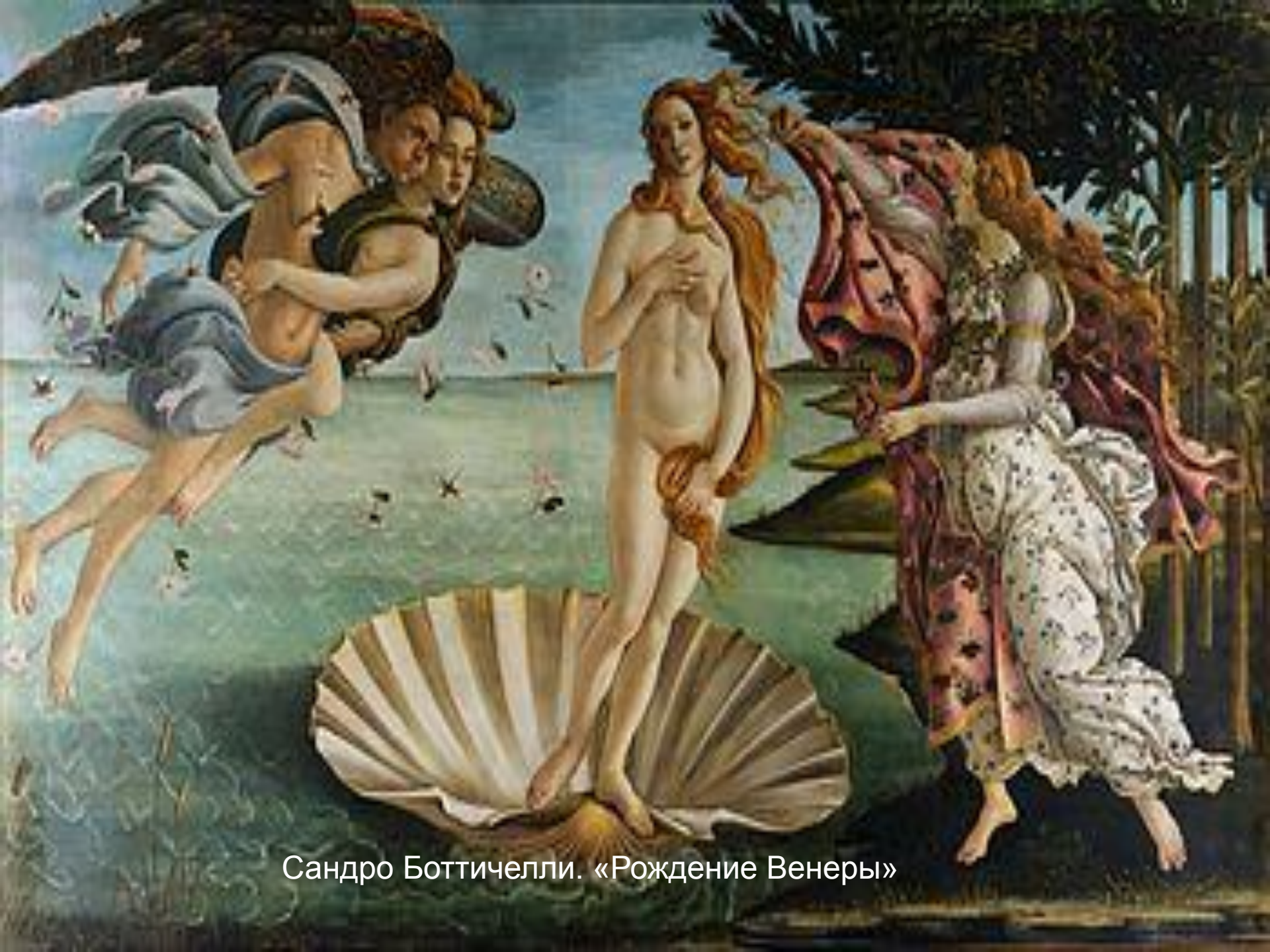
Сандро Боттичелли. «Рождение Венеры»