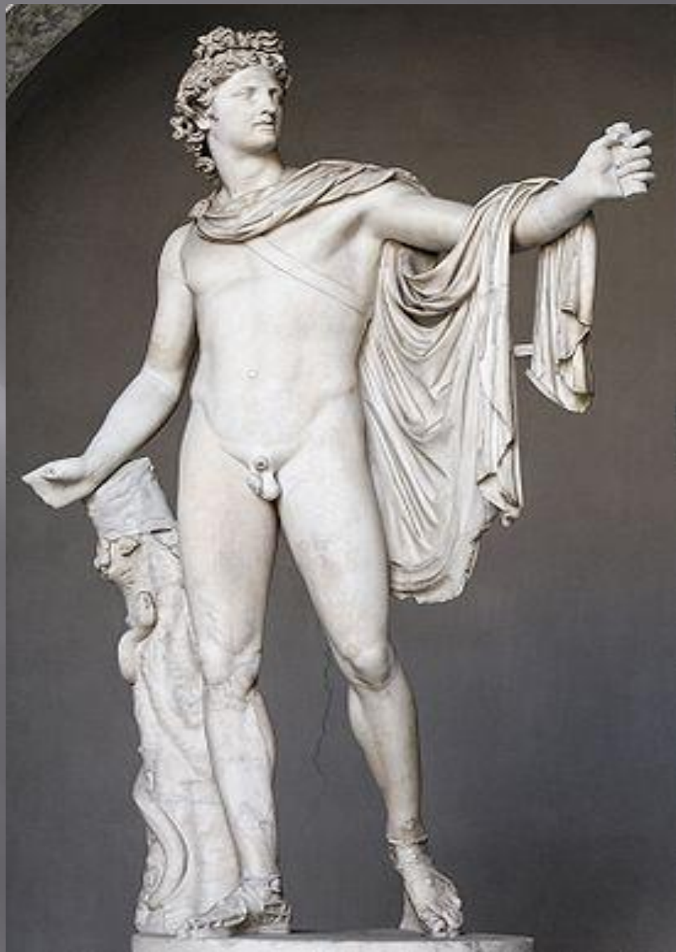
Аполлон Бельведерский. Леонардо