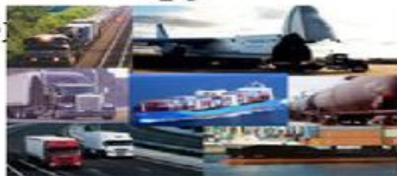
График движения самолётов, поездов и даже перемещение автотранспорта по некоторым автомобильным дорогам имеют высокую зависимость от IP-сетей. Отключение Интернета немедленно отзовется серьёзными перебоями в транспортной системе, отразится как на пассажирских, так и на грузовых перевозках, локальных и ме