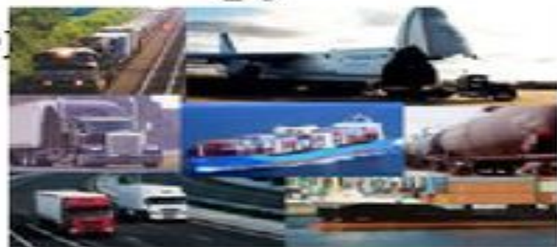
График движения самолётов, поездов и даже перемещение автотранспорта по некоторым автомобильным дорогам имеют высокую зависимость от IP-сетей. Отключение Интернета немедленно отзовется серьёзными перебоями в транспортной системе, отразится как на пассажирских, так и на грузовых перевозках, локальных и ме