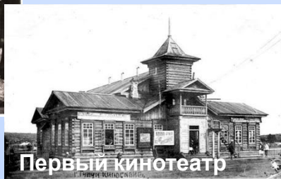
Первый кинотеатр «Сибирь»