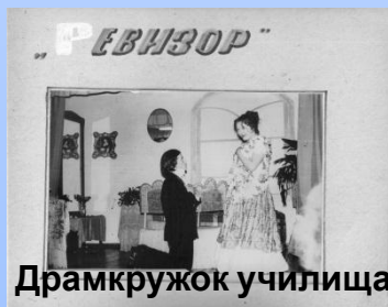
Драмкружок училища 1977г.