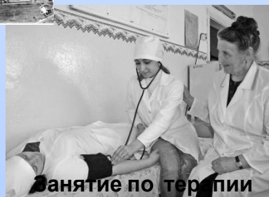
Занятие по терапии 2008г.