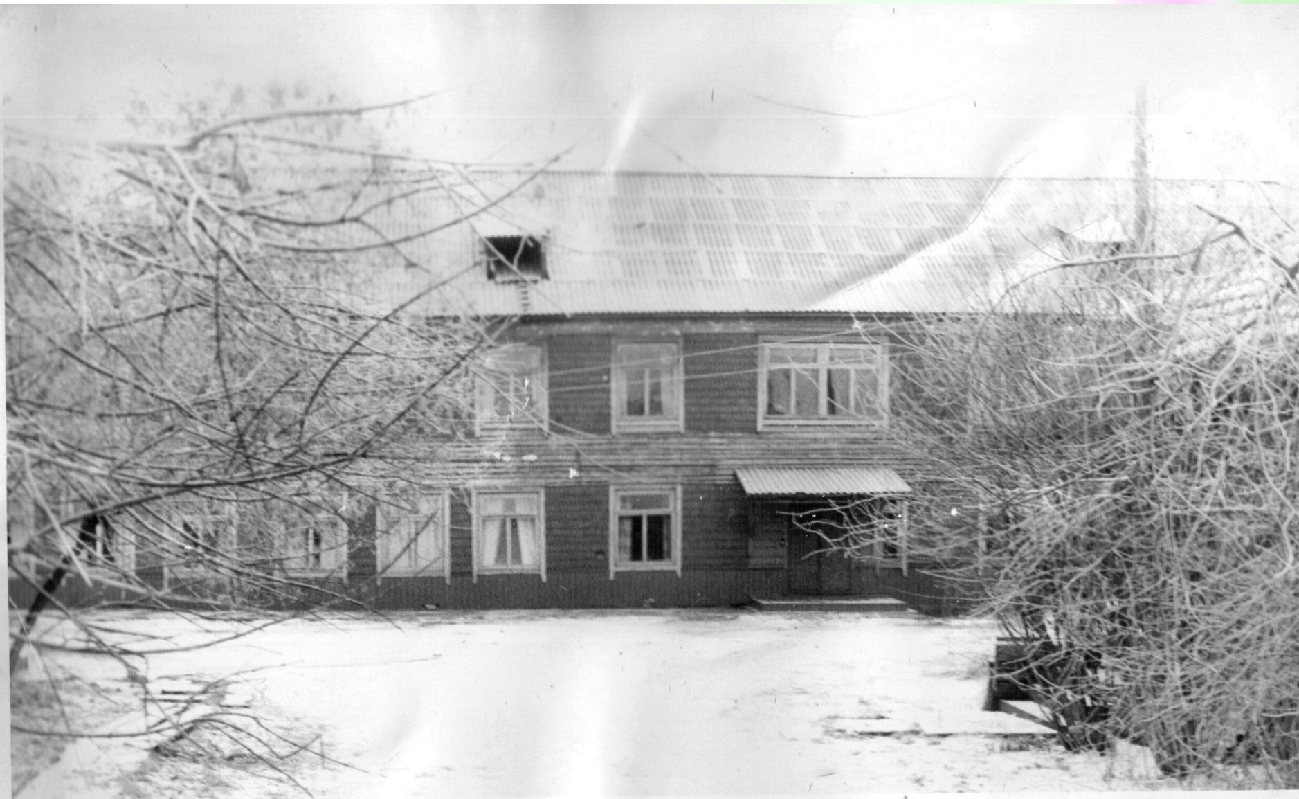
Здание училища 1974г. постройки