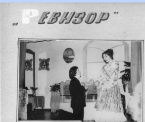
Драмкружок училища 1977г.