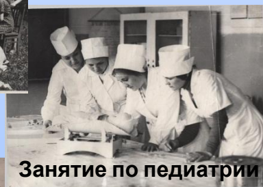
Занятие по педиатрии 1990г