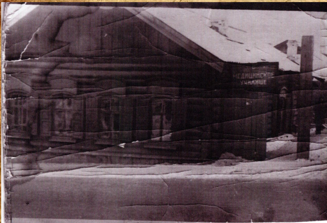
Здание медицинской школы 1936 года