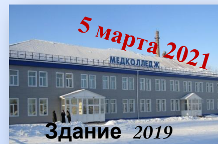
Здание 2019 года