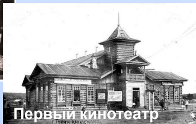
Первый кинотеатр «Сибирь»