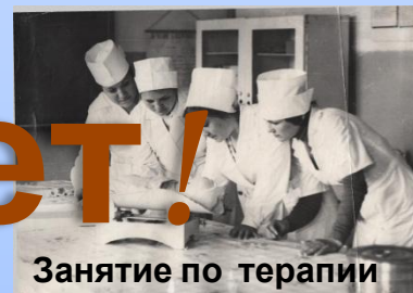
Занятие по терапии 2008г.