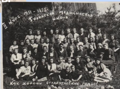
II курс 1951 - 1952г. Тулумская медицинская школа Как хороши студенческие годы!