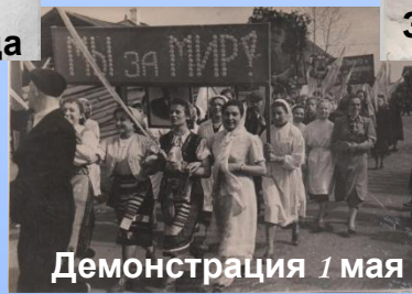
Демонстрация 1 мая 1958г.