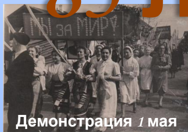
Демонстрация 1 мая 1958г.