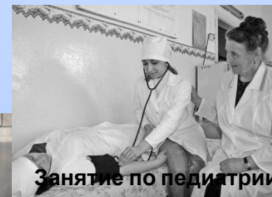
Занятие по педиатрии 1990г