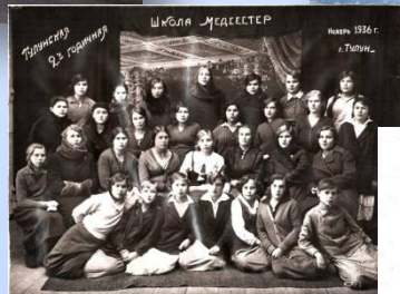
Школа медсестер Иванов 92 года Иванов 1936 г. г. Тулум.