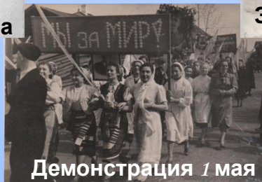
Демонстрация 1 мая 1958г.