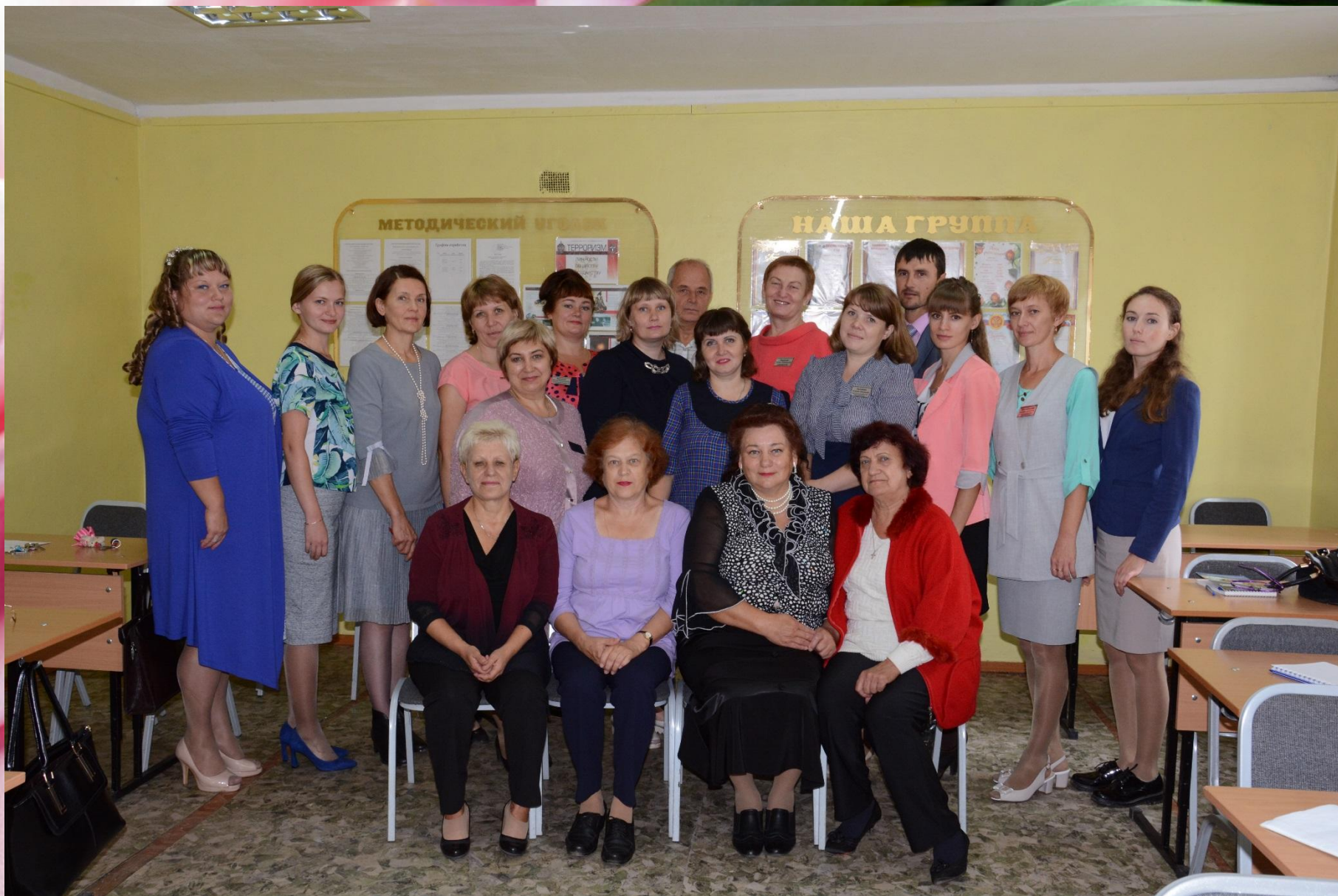
Коллектив Тулунского медицинского колледжа 2017 г.