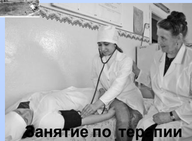
Занятие по терапии 2008г.