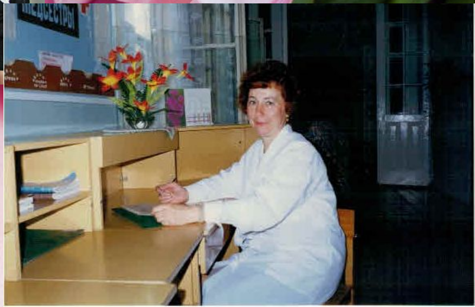
Коллектив Тулунского медицинского училища 2006г.