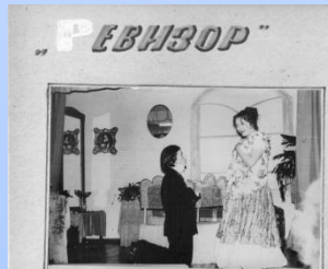
Драмкружок училища 1977г.