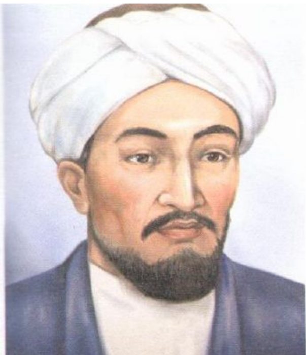
Әбу Насыр әл Фараби