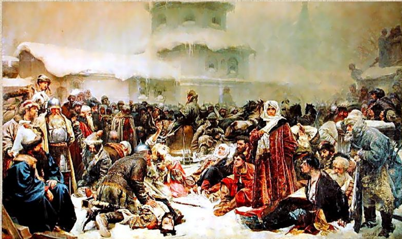
Разорение Новгорода Иваном Грозным