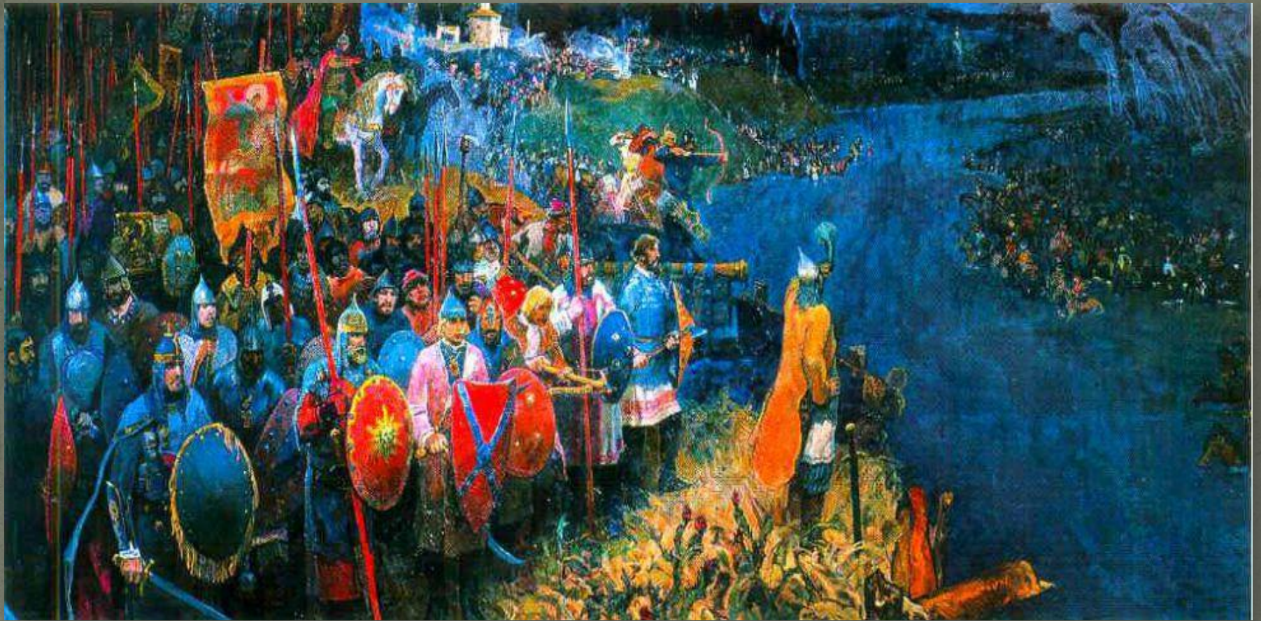
Стояние на реке Угре. Освобождение русской земли от татаро-монгольского ига.