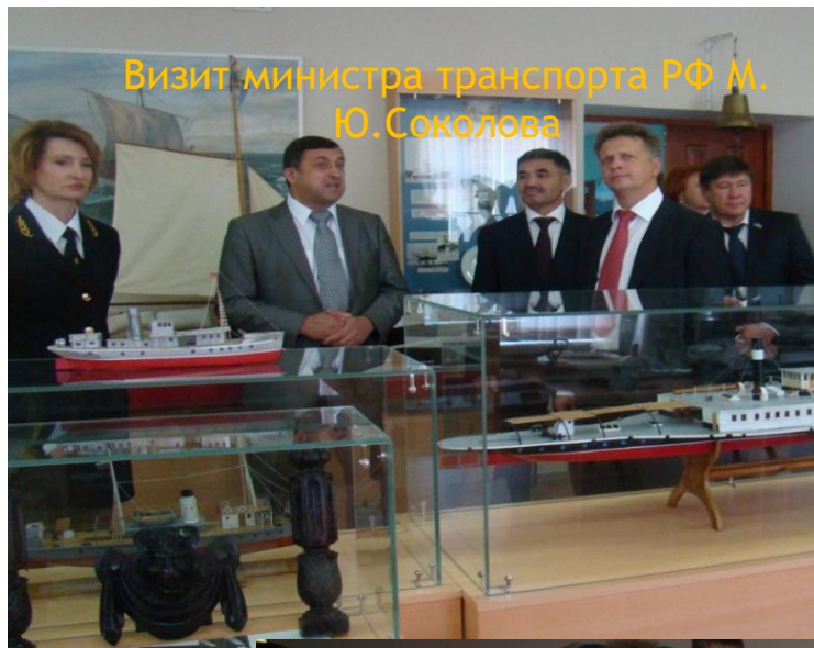
Визит министра транспорта РФ М. Ю. Соколова