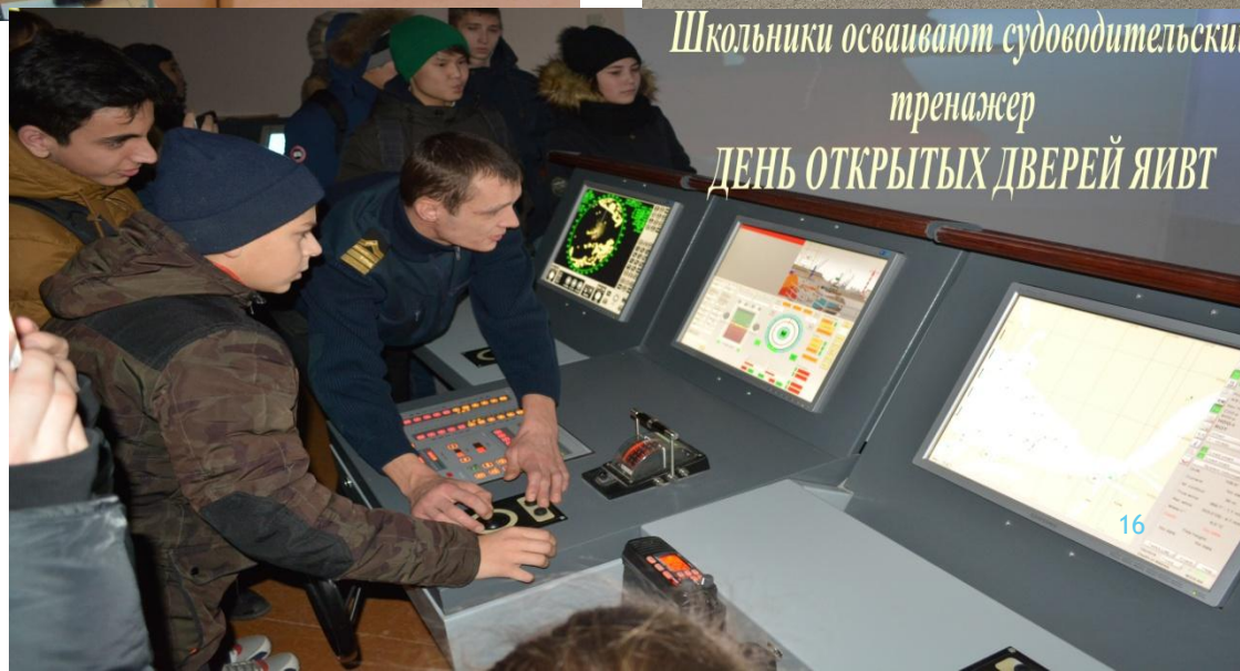
Школьники осваивают судоводительский тренажер ДЕНЬ ОТКРЫТЫХ ДВЕРЕЙ ЯИВТ