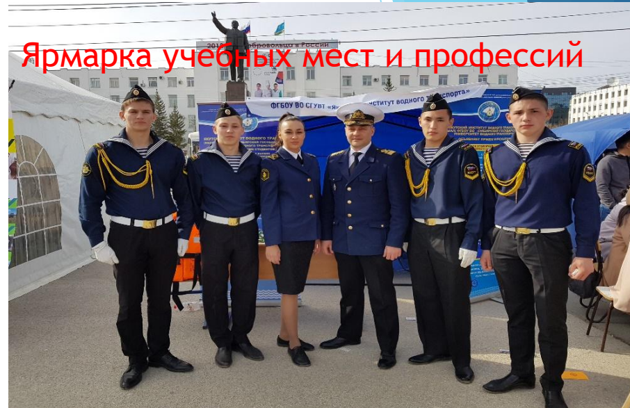
Ярмарка учебных мест и профессий