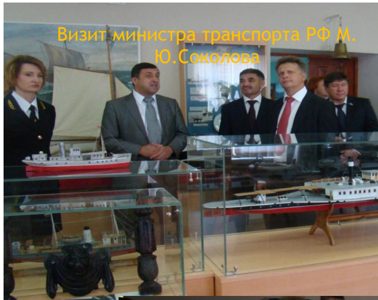
Визит министра транспорта РФ М. Ю. Соколова