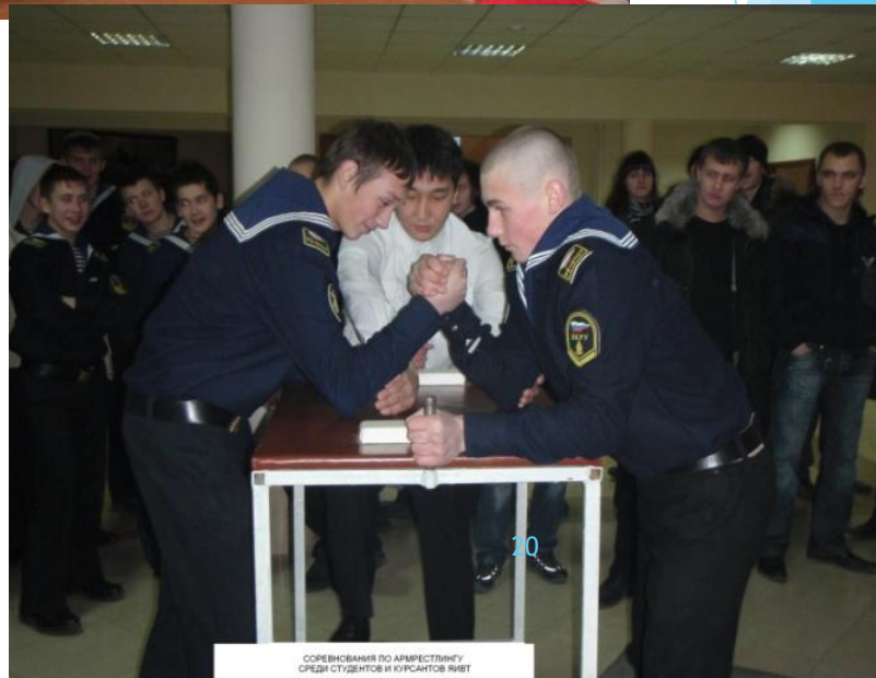
Соревнования по армреслингу среди студентов и курсантов ЯФУТ