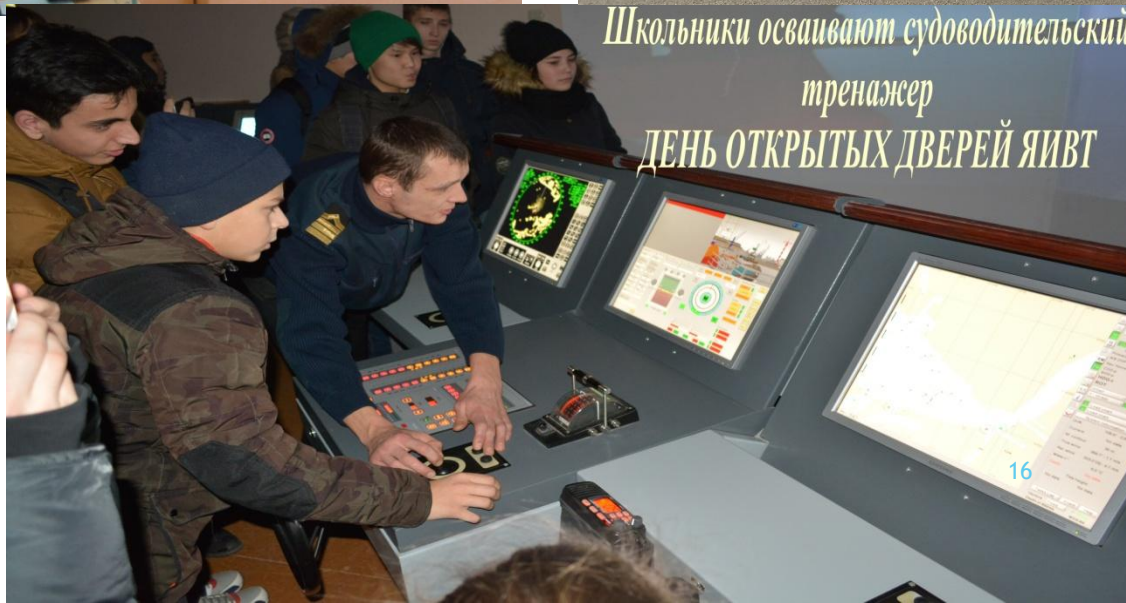
Школьники осваивают судоводительский тренажер ДЕНЬ ОТКРЫТЫХ ДВЕРЕЙ ЯИВТ