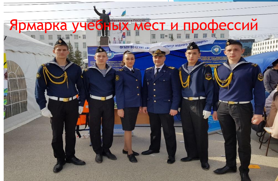
Ярмарка учебных мест и профессий