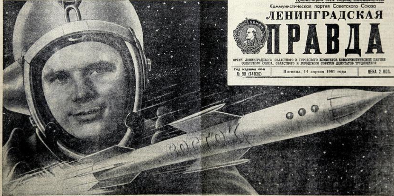
Иллюстрация В. ТАДЫШЕРИНА