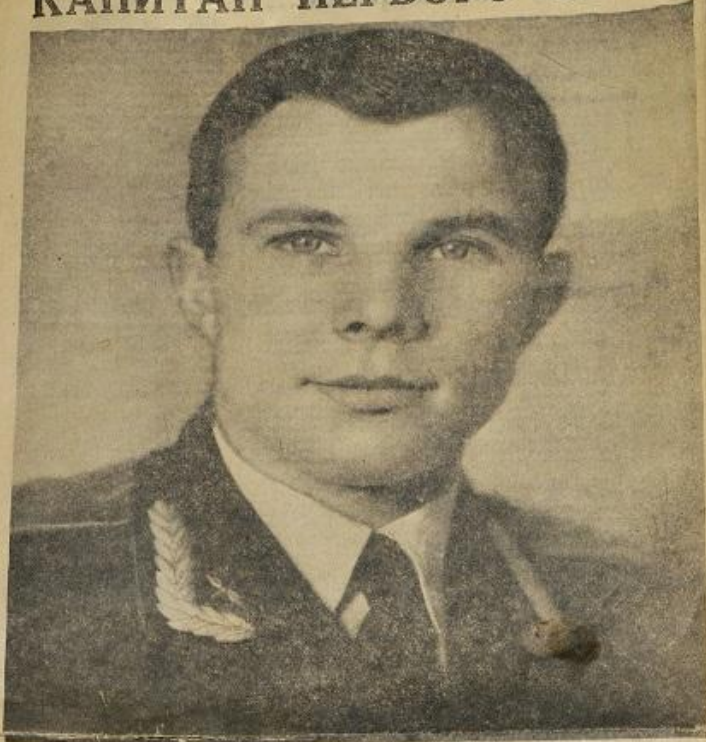
ЮРИЙ АЛЕКСЕЕВИЧ ГАГАРИН.