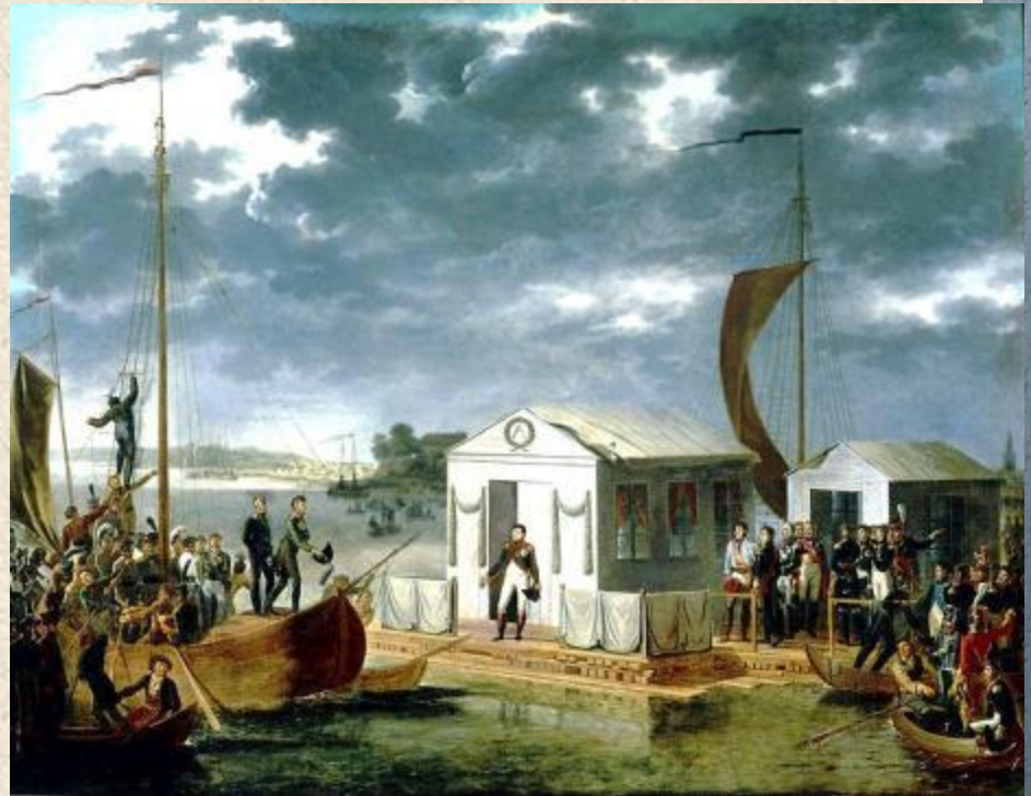
Встреча императоров в Тильзите

Наполеон заклучил мир с Россией. Два императора встретились в Тильзите . На плоту они обменялись рукопожатиями и подписали мирный договор.