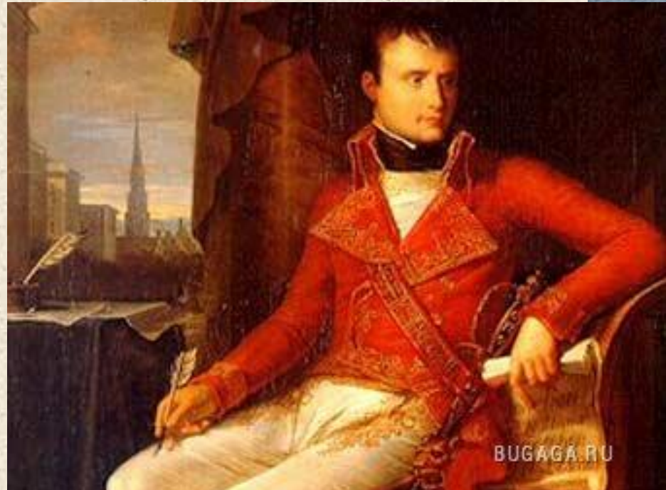
Первый консул – Бонапарт