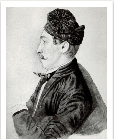
Убийца Лермонтова Николай Мартынов