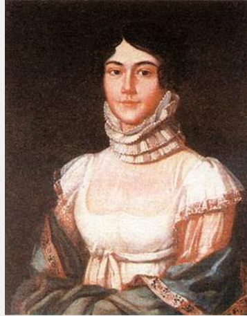
Мать. Марья Михайловна Лермонтова (1795-1817)

Капитан в отставке, красивый, статный и добрый мужчина. Он был часто вспыльчив и раздражителен.