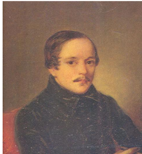
М. Ю. Лермонтов в 1840 году

В 1840 за дуэль с сыном французского посла Э. Барантом поэт снова отправлен в ссылку. Прибыв на Кавказ, Лермонтов окунулся в боевую жизнь, был задействован в военных действиях и на первых же порах отличился, согласно официальному донесению, «мужеством и хладнокровием».