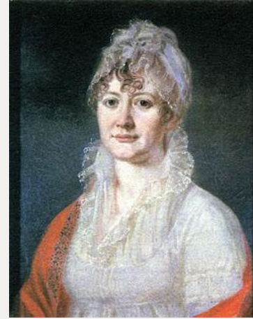
Бабушка. Елизавета Алексеевна Арсеньева (1773-1845)

Была одаренной и талантливой женщиной, любила играть на фортепиано. Умерла от на 22-м году жизни.