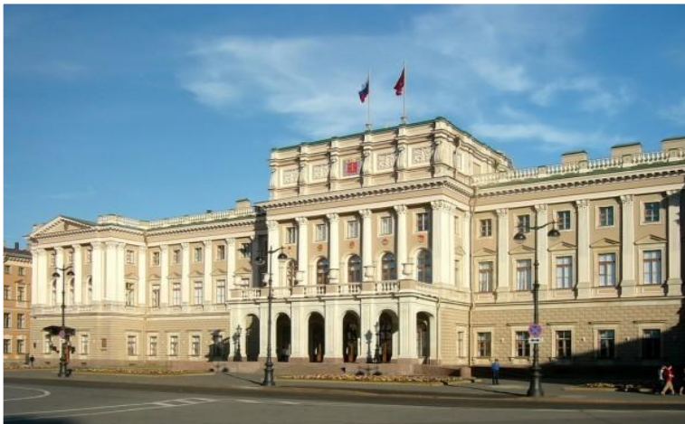
Мариинский дворец. Бывшее здание Школы Гвардейских Подпрапорщиков и Кавалерийских Юнкеров, в которой учился Лермонтов

Школа юнкеров сделала поэта образованным офицером, обладающим широким кругозором, знанием военной истории и основ военного искусства. В 1834 году Лермонтов начал служить в Гусарском полку в Царском селе. Служба в полку состояла не только в обычных военных занятиях, учениях, парадах, но и в обязательном посещении придворных балов.