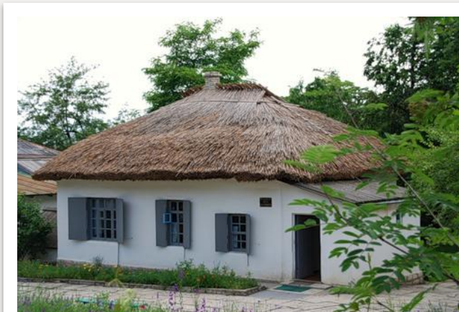
Домик в Пятигорске, где Лермонтов прожил последние два месяца своей жизни