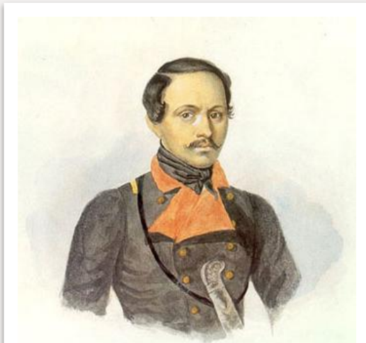
Последний прижизненный портрет Лермонтова. 1841 г.

В Пятигорске, возвращаясь со второй ссылки, Лермонтов встретил старого товарища Мартынова. Тот, оскорбившись на злую шутку поэта, вызывает Лермонтова на дуэль. 15 (27) июля 1841 года на этой дуэли Лермонтов был убит.