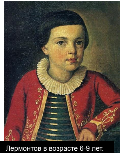
Лермонтов в возрасте 6-9 лет.

Своё детство он провёл в поместье бабушки(Тарханы, Пензенская губерния), которая прилагала все усилия, чтобы дать внуку всё, на что только может претендовать продолжатель рода Лермонтовых. Лермонтов был болезненным ребенком и всё детство страдал золотухой.