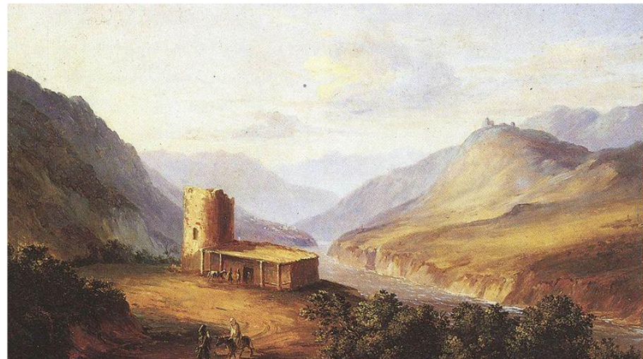
Военно-Грузинская дорога близ Мцхеты. 1837. Картина Лермонтова.

Благодаря ходатайствам бабушки возвращается в Петербург, восстанавливается на службе. Дальнейшее творчество Михаила Юрьевича Лермонтова связано с редакцией "Отечественных записок".