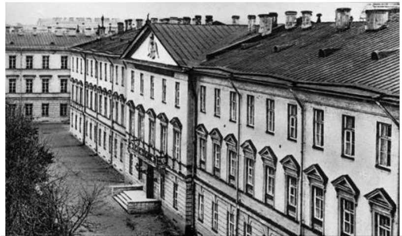
Николаевское кавалерийское училище, в стенах которого с 1832 по 1834 учился М.Ю. Лермонтов.