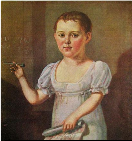
М. Ю. Лермонтов в возрасте 3-4 лет.

В ночь с 2 (14) октября на 3 (15) октября 1814 года в Москве в семье офицера на свет появился будущий великий русский поэт Михаил Лермонтов .