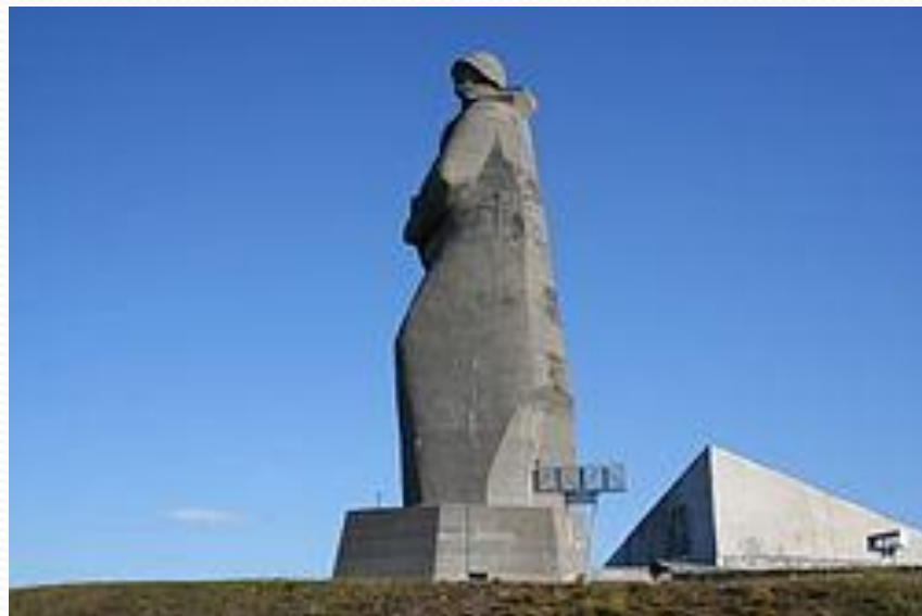
памятник защитникам Советского Заполярья (Мурманский Алёша).