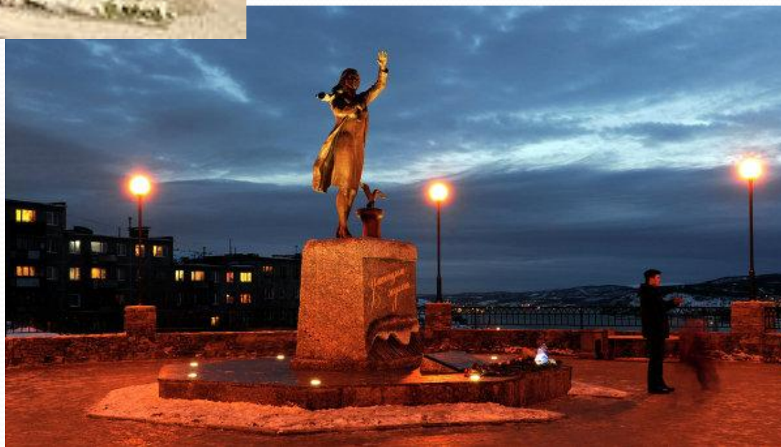
Памятник жёнам моряков.