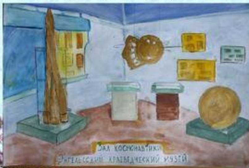
ДЛЯ КОСМОНАВТИКИ ЭНГЕЛЬСКИЙ КРАТОВЕДЧЕСКИЙ МУЗЕЙ