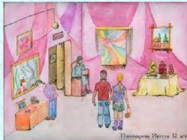
Полтавщина Катерина 12 лет