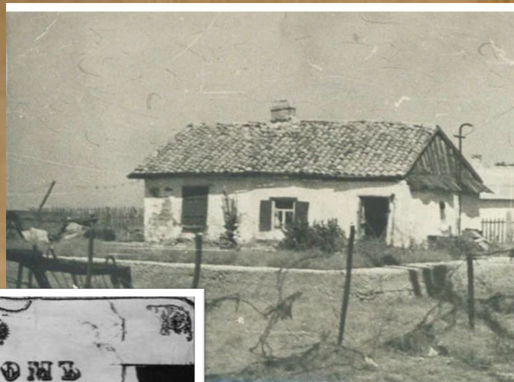
Здесь родился Георгий Седов

Он хотел заниматься морской наукой и экспедиционной деятельностью. Седов поступил вольнопределяющею в военно-морской флот и прибыл в Севастополь