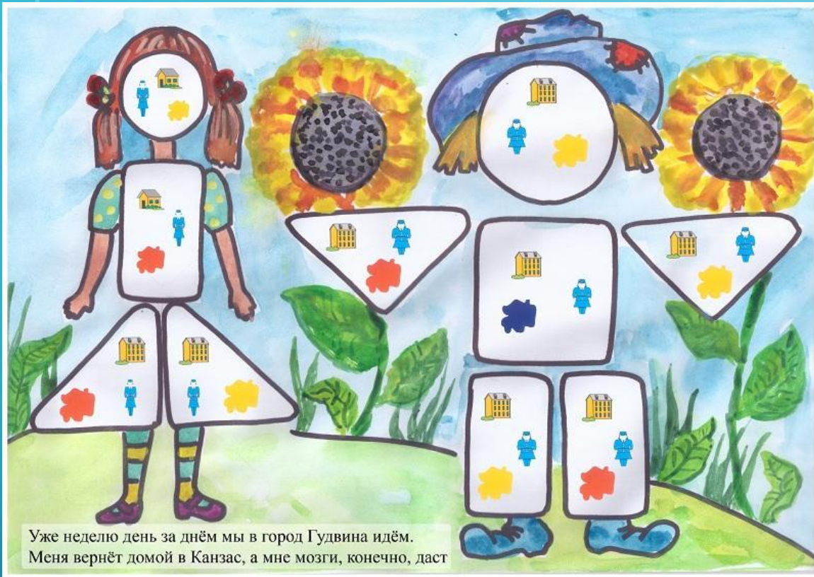
Уже неделю день за днём мы в город Гудвина идём. Меня вернёт домой в Канзас, а мне мозги, конечно, даст