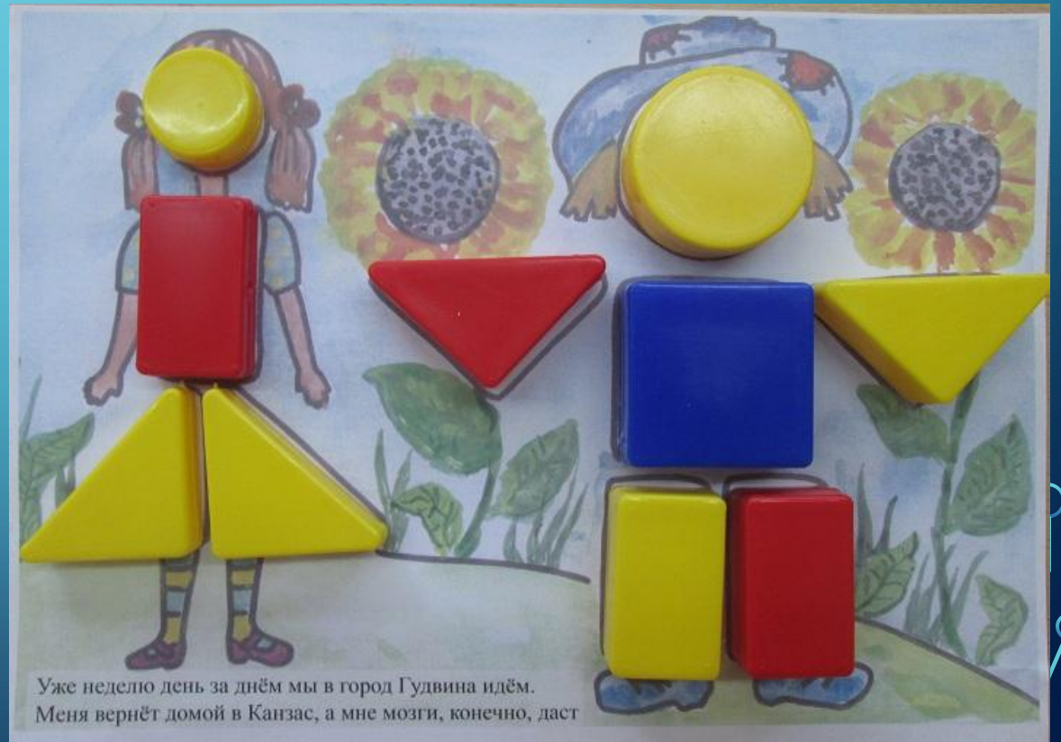
Уже неделю день за днём мы в город Гудвина идём. Меня вернёт домой в Канзас, а мне мозги, конечно, даст