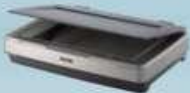
Настольный (планшетный) сканер