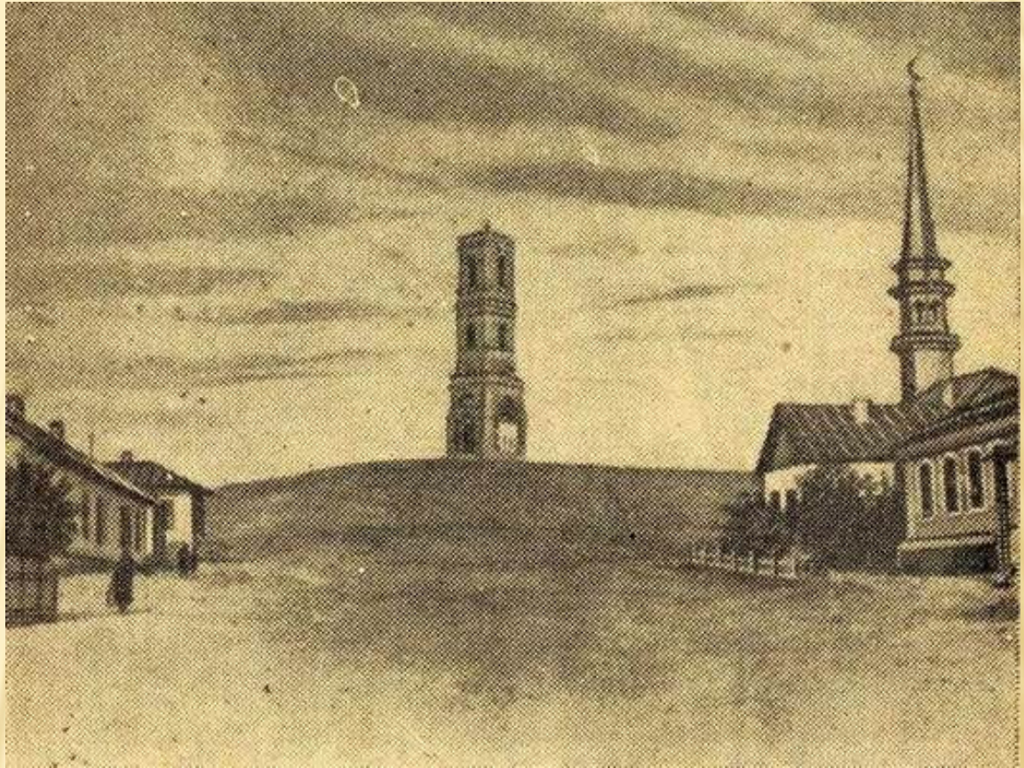
Гора Преображенская в центре города Орска. На этом месте был впервые заложен г. Оренбург в 1735 году

Умер И.К. Кирилов в Самаре 14 апреля 1737 года от туберкулеза.