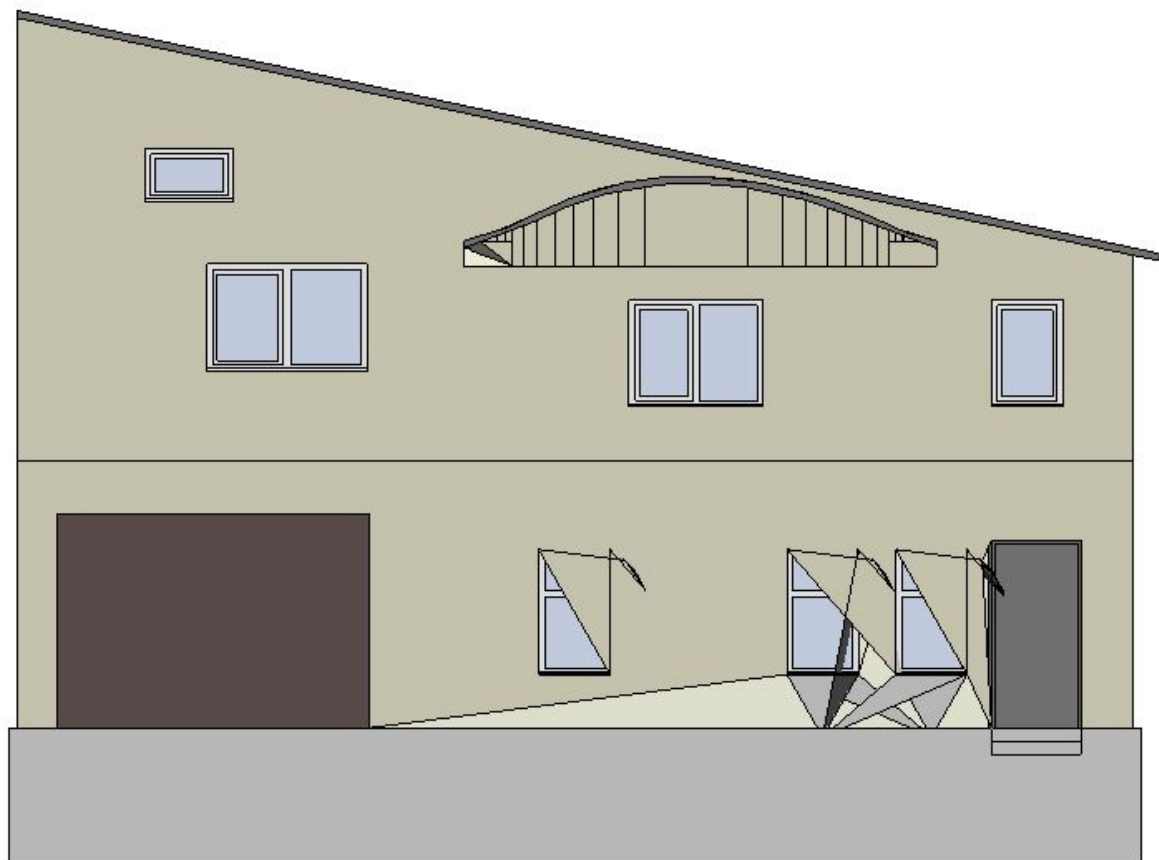
Вот таким получился дом по ул. Шевченко д.12.