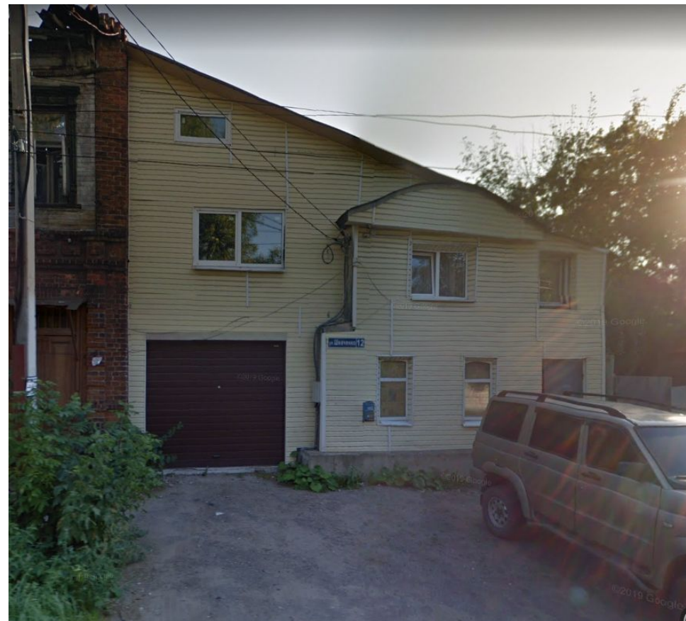
ул. Шевченко д.12

Дом по ул. Шевченко д.12 пока в жилом состоянии