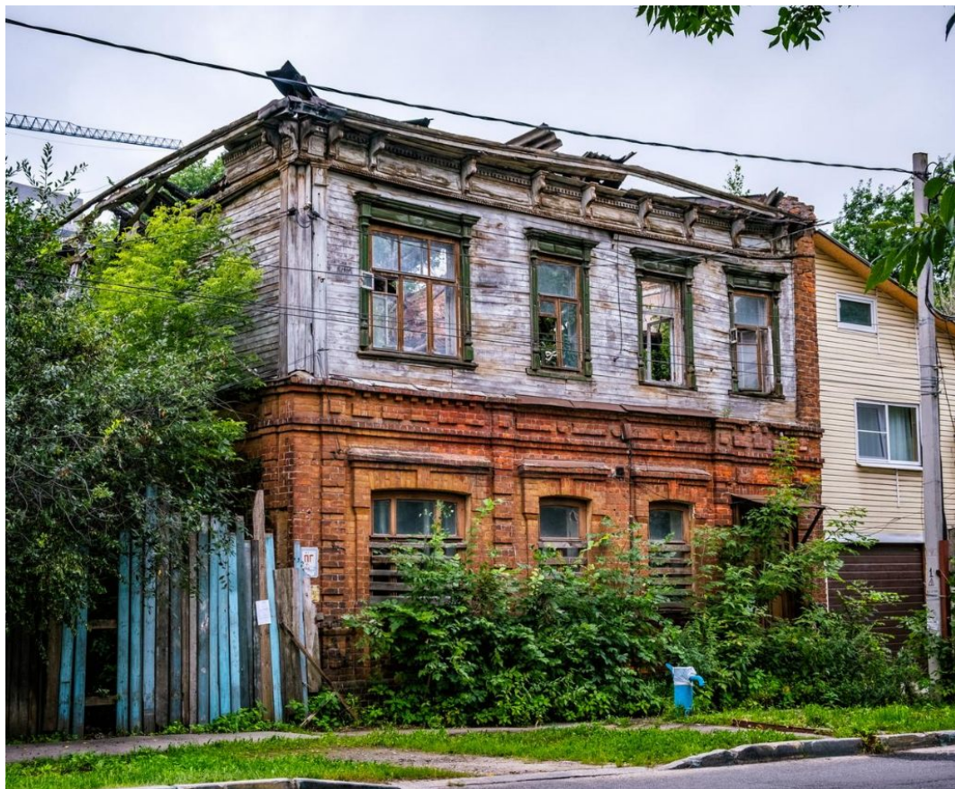
ул. Шевченко д.14

По всей видимости пострадал и наш дом по адресу ул. Шевченко д.14