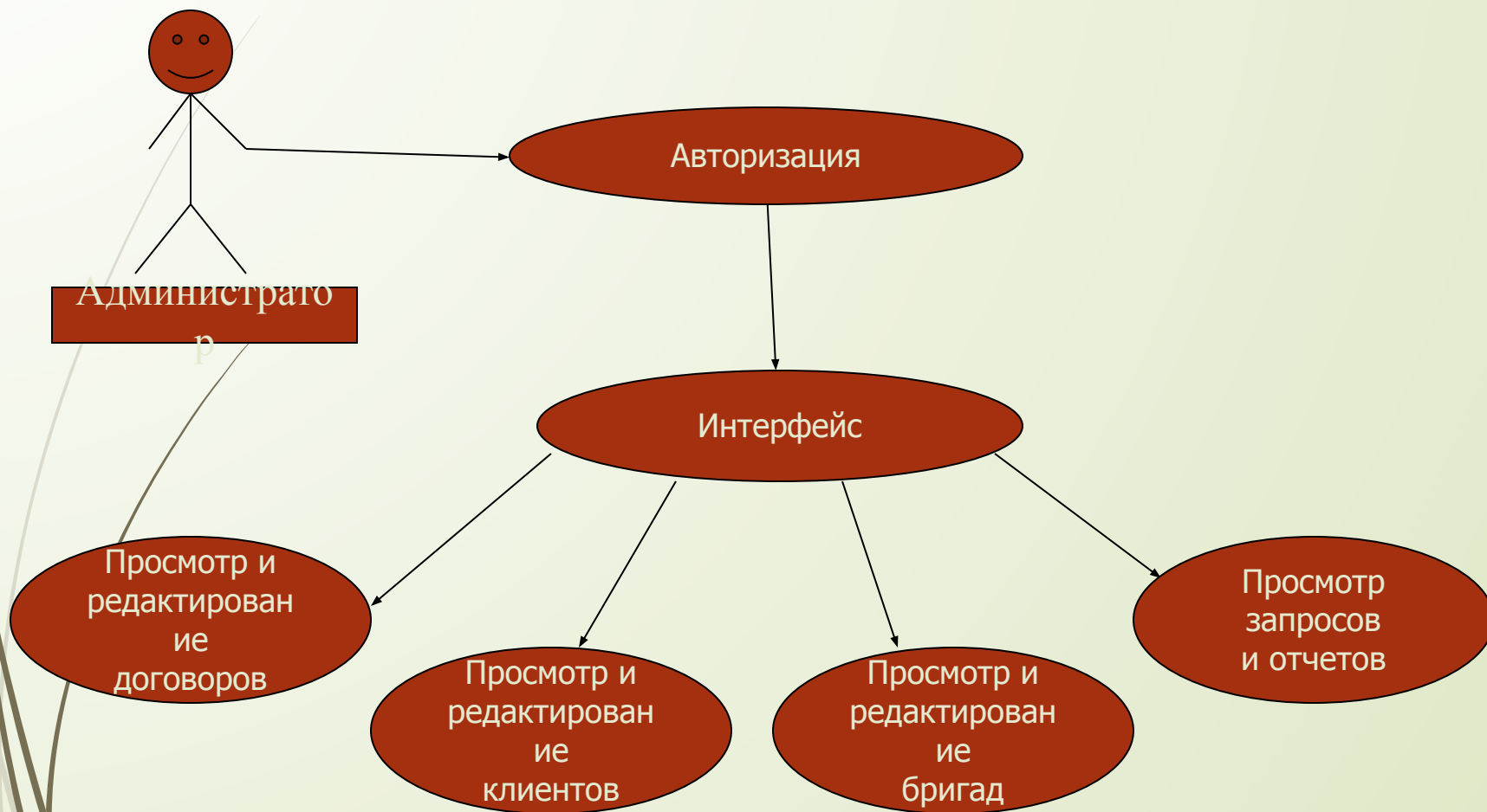
Диаграмма Use Case