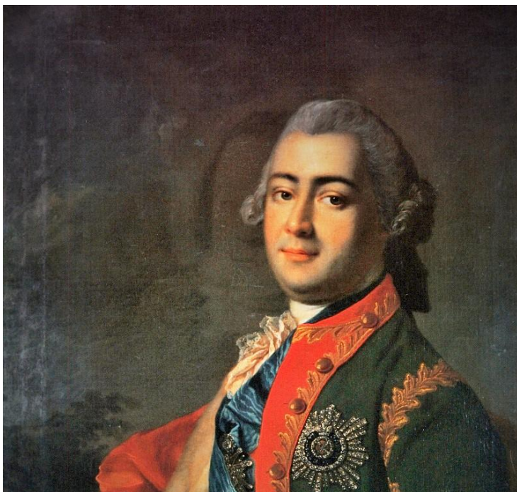
Алексей Григорьевич Разумовский