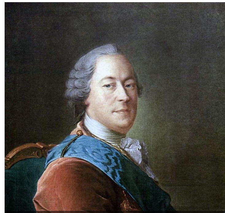
Михаил Илларионович Воронцов