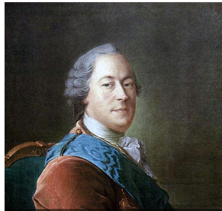
Михаил Илларионович Воронцов