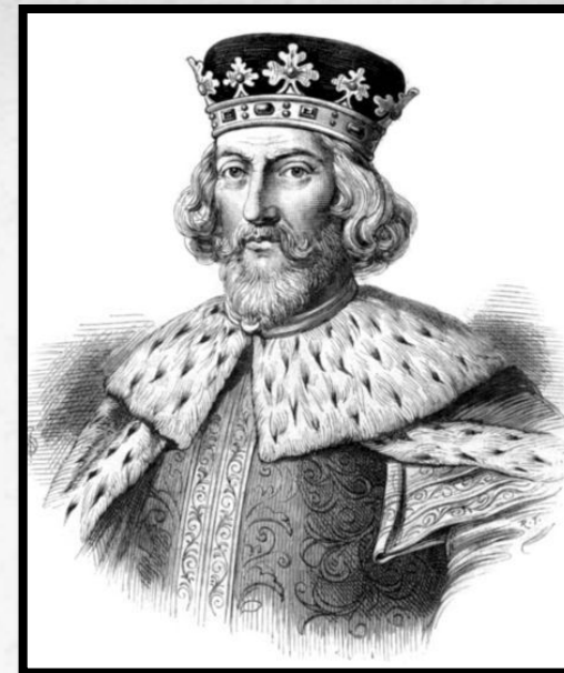
Иоанн Безземельный (1199-1216)

- Вспомните, какие территории потерял английский король во Франции?