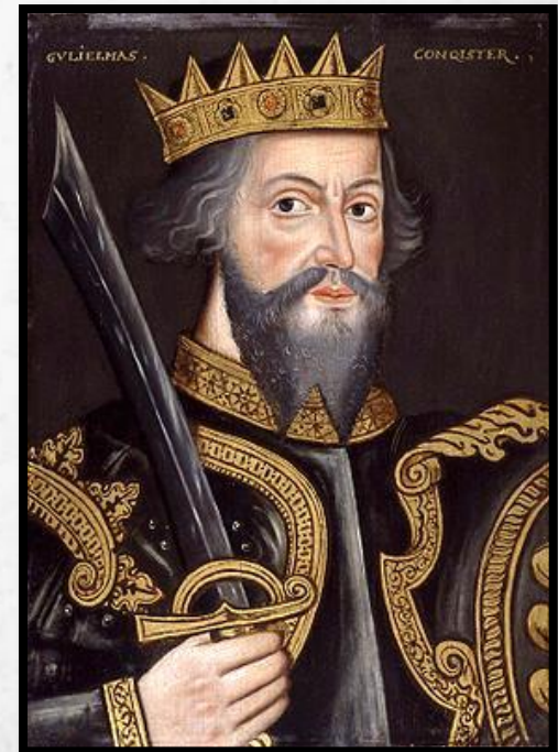
Вильгельм I Завоеватель

В 1066 г. умер король Англии Эдуард, не оставив наследников. Власть захватил представитель англосаксонской знати Гарольд. Вильгельм, находясь в родстве с английской династией, предъявил свои права на английский престол.