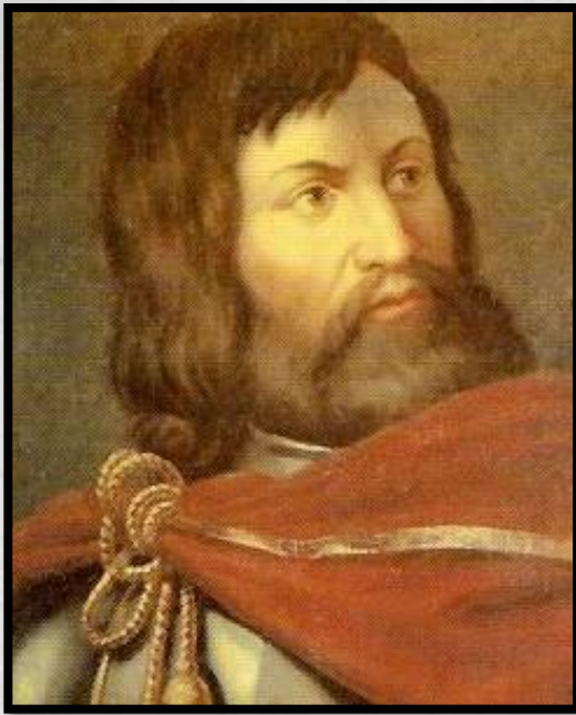
Граф Симон де Монфор

Симон де Монфор впервые созвал собрание представителей духовных и светских феодалов, рыцарей и горожан – парламент