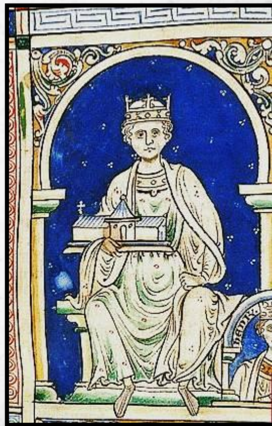
Генрих II Плантагенет (1154-1189) на миниатюре XII века

Опираясь на поддержку горожан и рыцарей, королевская власть одержала победу над крупными феодалами. В середине XII века в Англии утвердилась династия Плантагенетов, основателем которой стал Генрих II.