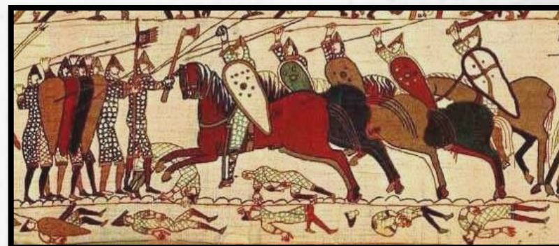
Битва при Гастингсе. Гобелен. XI век