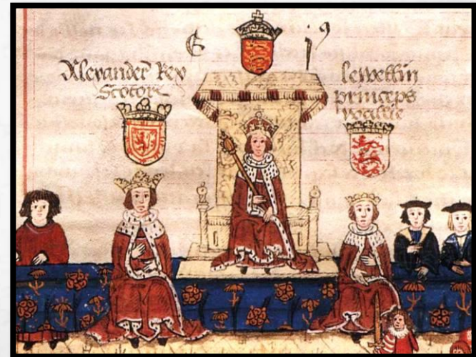
Король Эдуард I в парламенте, 1272 г.

Хотя войско Монфора потерпело поражение в гражданской войне и власть короля была восстановлена, короли и бароны продолжили созывать парламент.