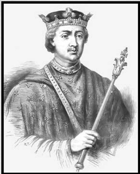
Генрих II в представлении художника начала XX века

Генрих II был коренастым, широкоплечим человеком, обладавшим резким и грубым голосом. Он имел переменчивый нрав: мог быть открытым, щедрым, но, когда гневался, превращался в злобного тирана. Генрих владел шестью языками, но не знал английского; имел редкую память и обширные знания. Небрежно одетый, умеренный в пище, безразличный к жизненным удобствам, он был неумом в делах, полон энергии и решимости.