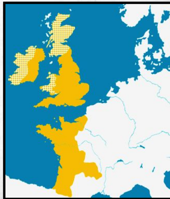
Держава Генриха II

Имея огромные владения во Франции и Англии, Генрих приложил все силы, чтобы подчинить государство своей власти. Он провел ряд важных государственных реформ.