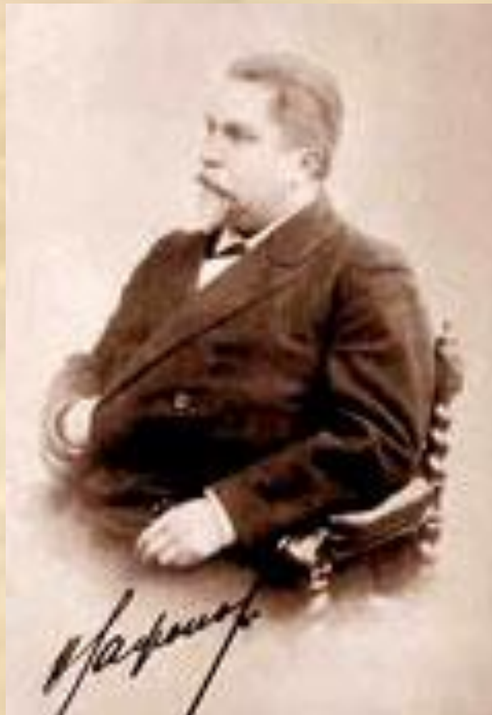
Василий Ильич Сафонов (1852-1918 г.)