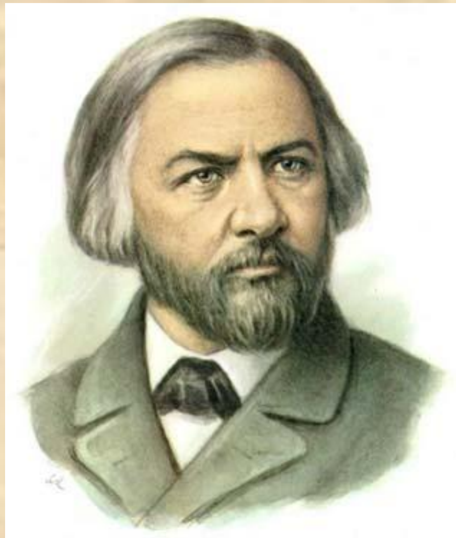
Михаил Иванович Глинка (1804-1857 г.)