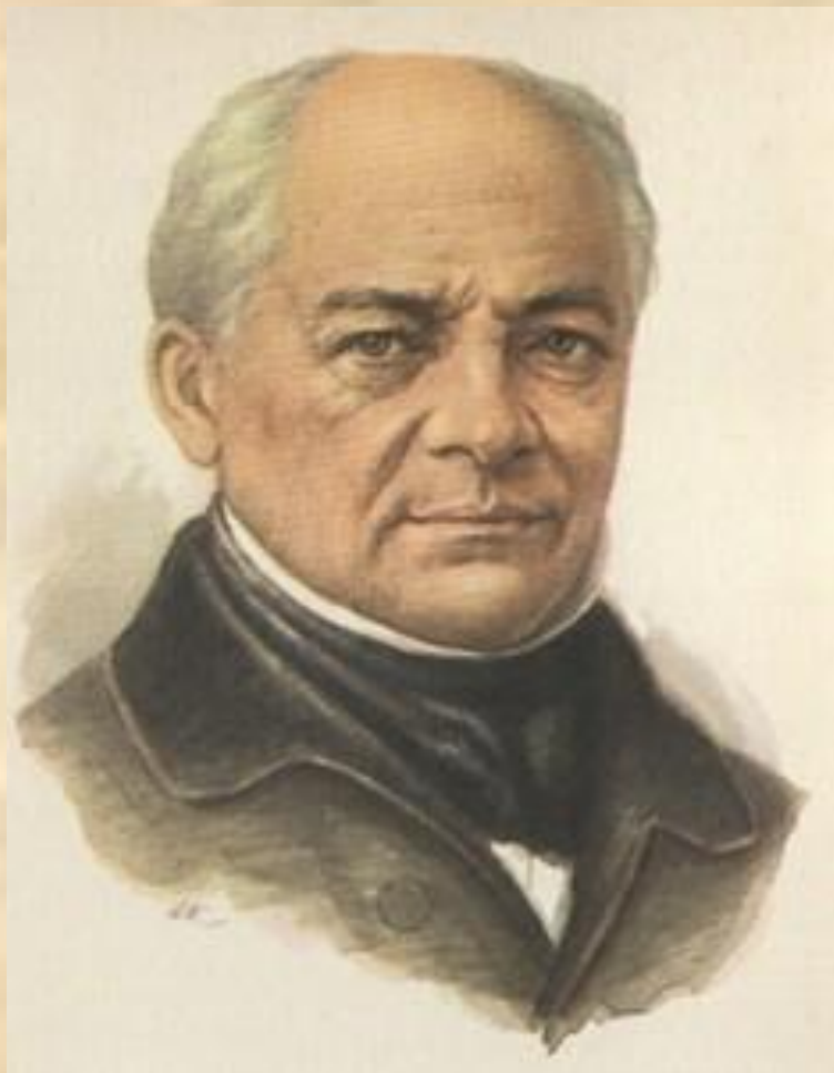
Алексей Николаевич Верстовский (1799-1862 г.)