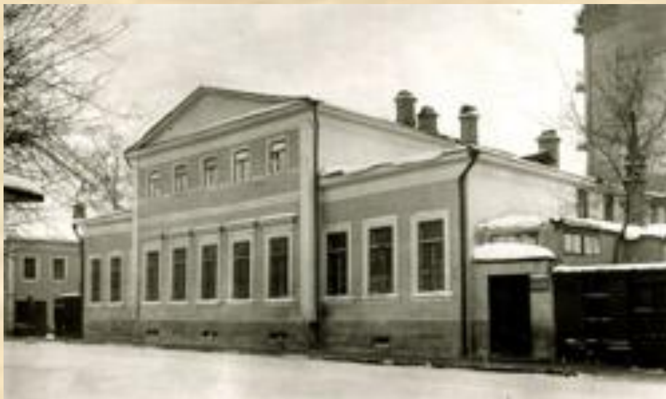
Гнесинское училище в 20-е годы