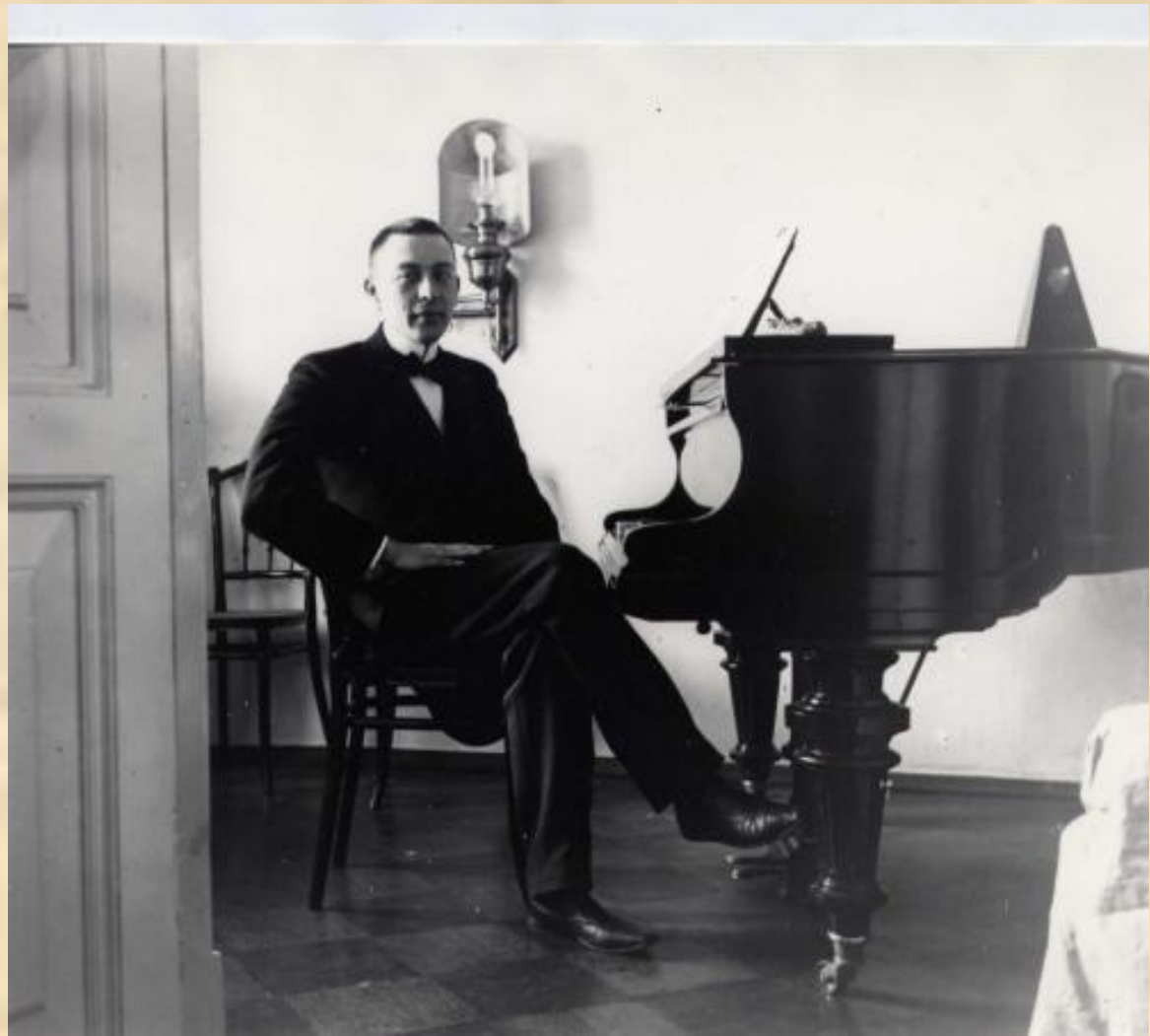
Сергей Васильевич Рахманинов (1873 – 1943 г.)