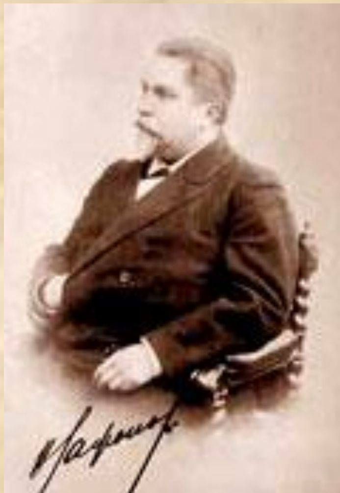
Василий Ильич Сафонов (1852-1918 г.)