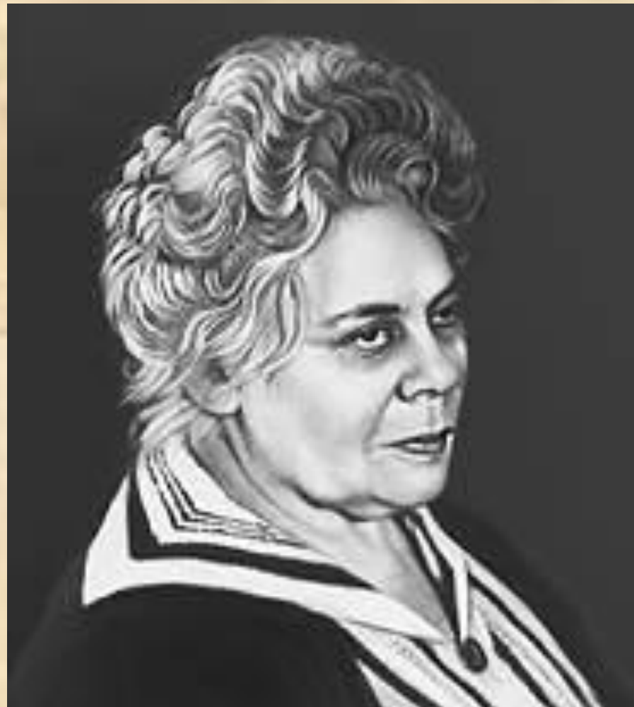
Елена Фабиановна Гнесина (1874-1967 г.)