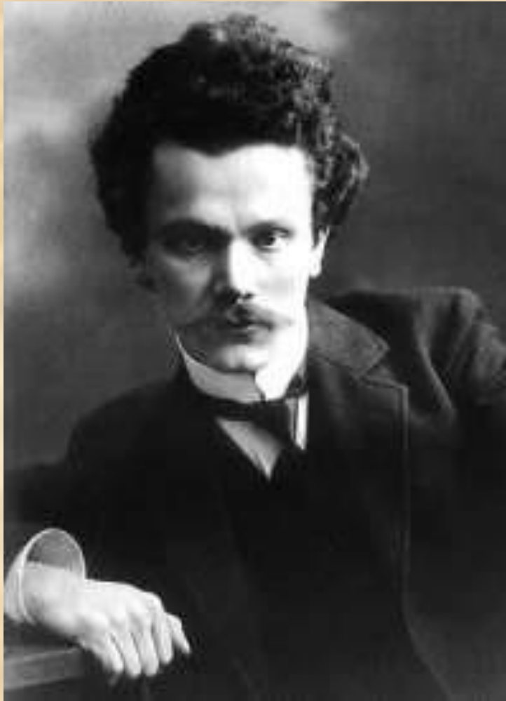
Александр Борисович Гольденвейзер (1875-1961 г.)