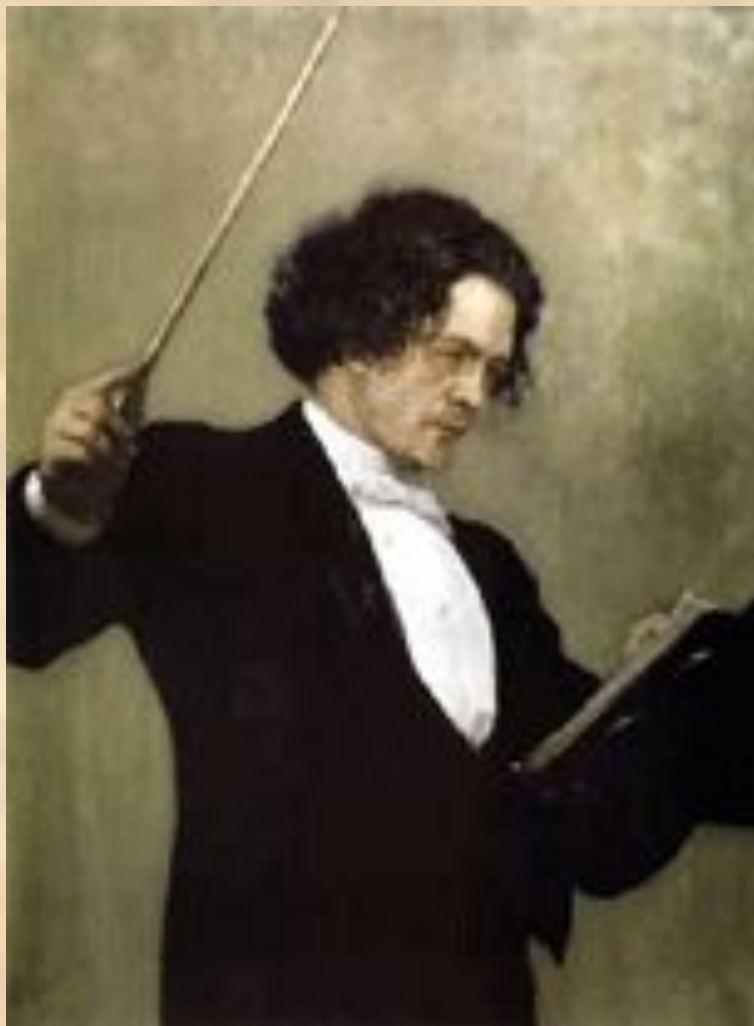
Антон Григорьевич Рубинштейн (1829-1894 г.)