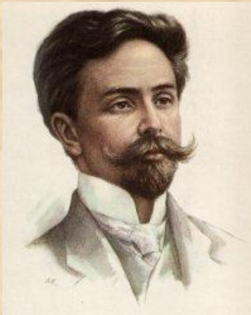
Александр Николаевич Скрябин (1872 – 1915 г.)