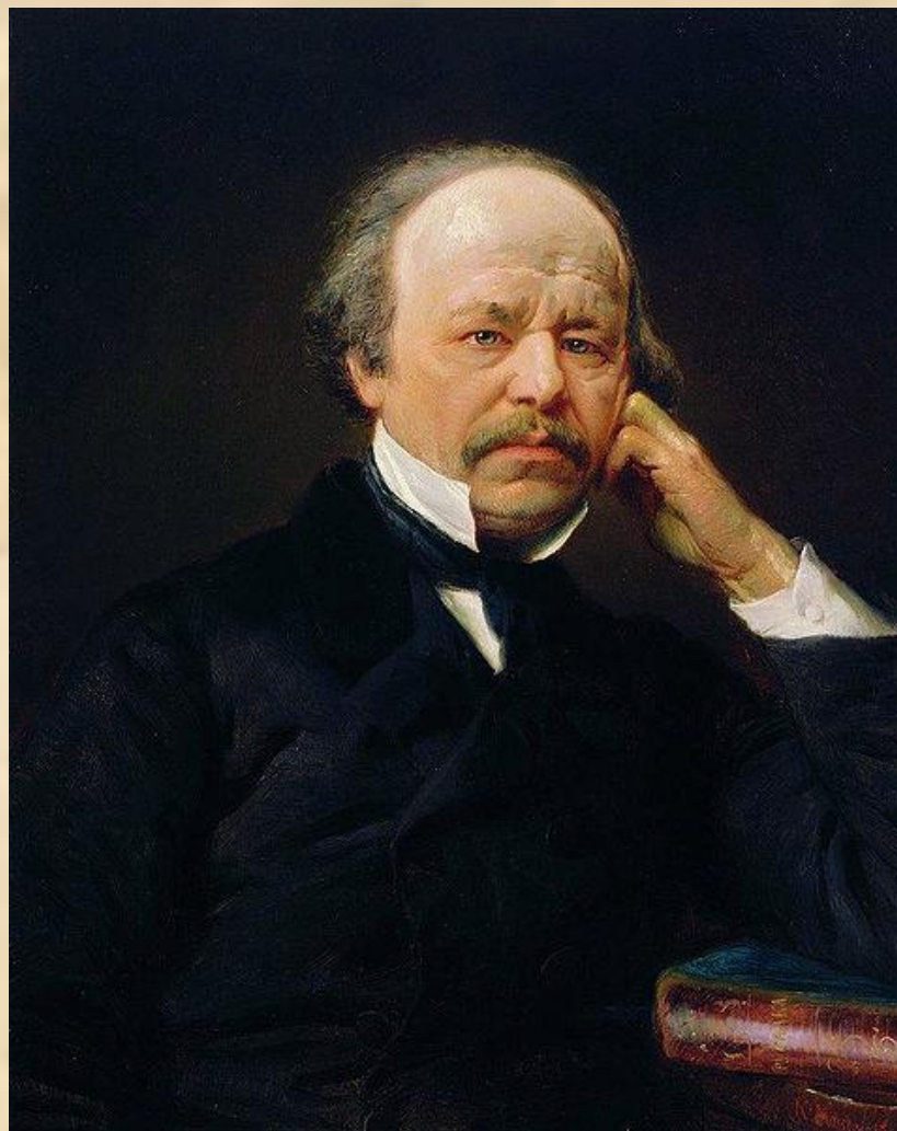
Александр Сергеевич Даргомыжский (1813-1869 г.)