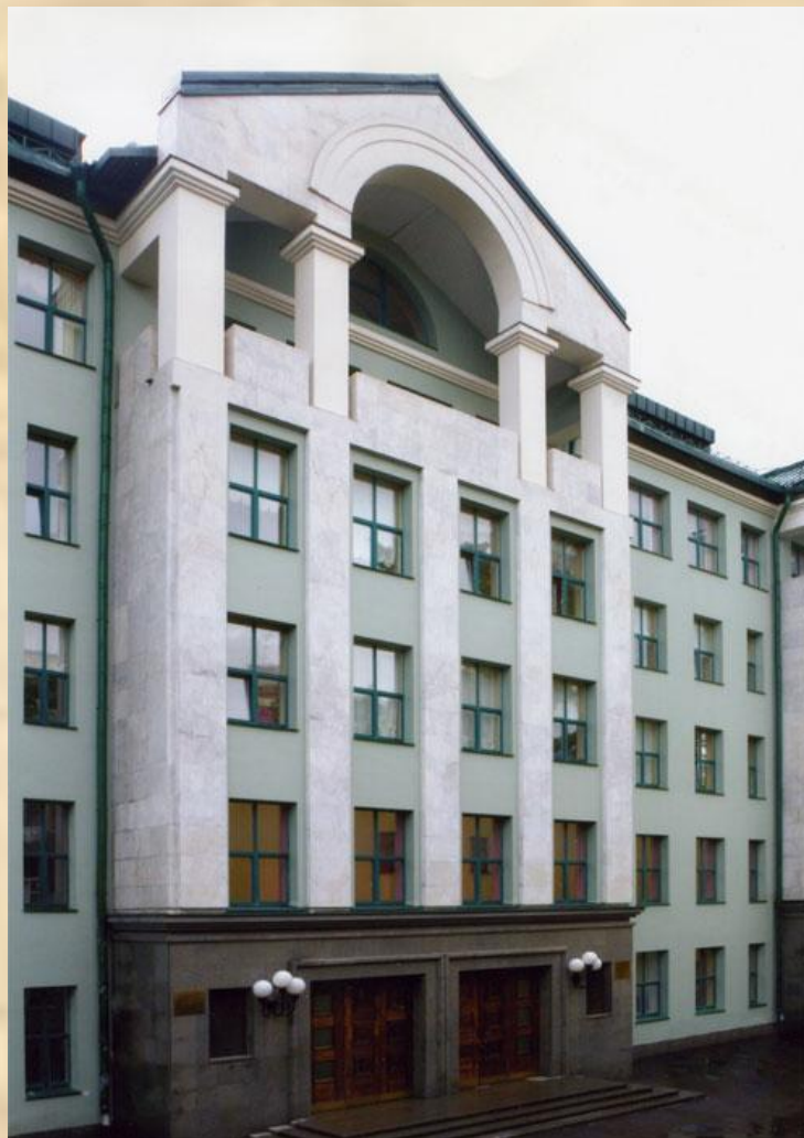
Центральная музыкальная школа при Московской консерватории