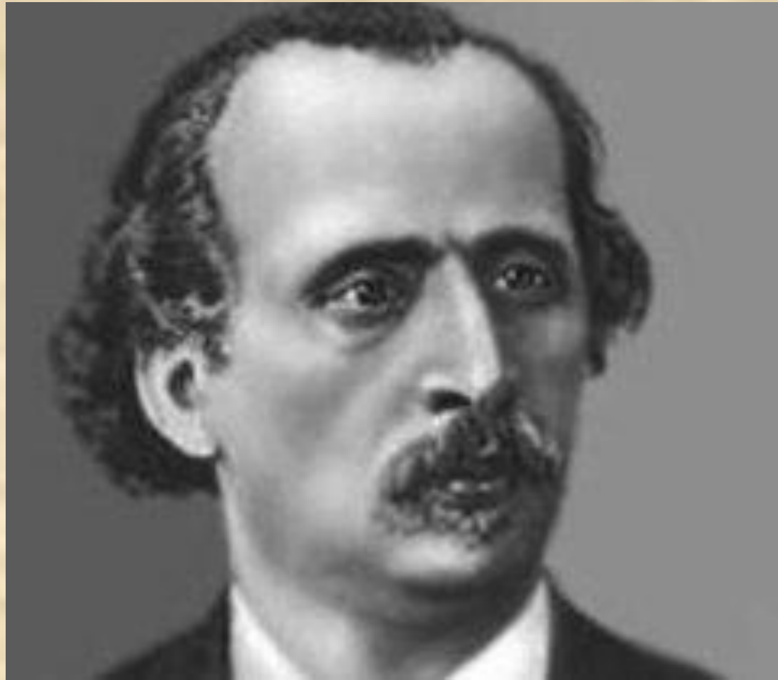
Николай Григорьевич Рубинштейн (1835-1881 г.)