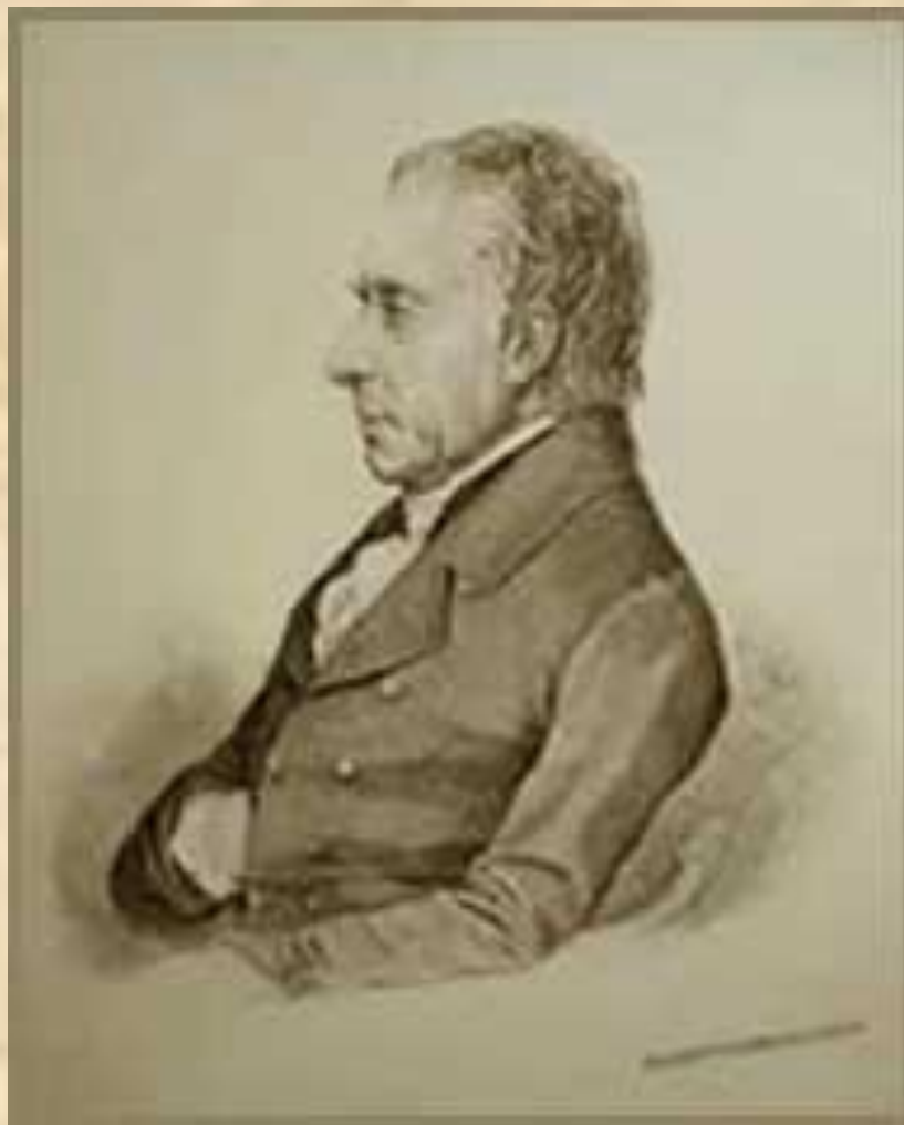
Дмитрий Степанович Бортнянский (1751-1825 г.)