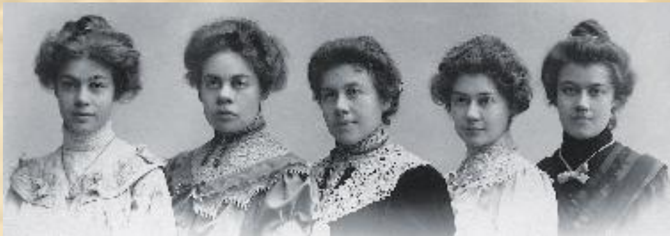
Сестры Гнесины (слева направо): Ольга, Елена, Евгения, Мария, Елизавета.