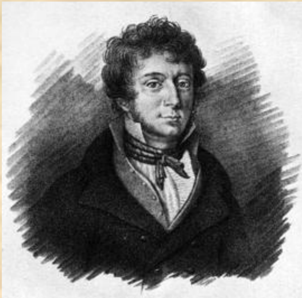
Джон Фильд (1782-1837)