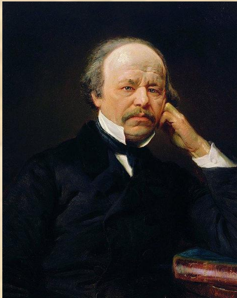
Александр Сергеевич Даргомыжский (1813-1869 г.)