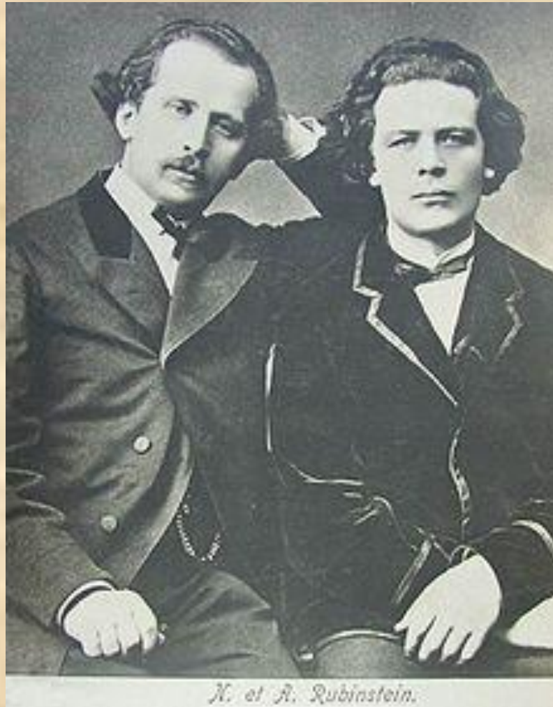
Братья Рубинштейны -1910 г.