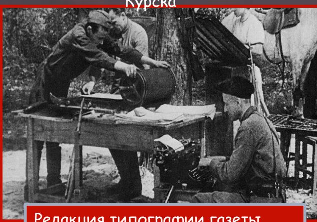
Редакция типографии газеты «Партизанская правда». Орловская область, 1942 г.

В таких непростых условиях производилась печать партизанских газет и листовок. Оборудование нередко поставляли из тыла, но краска и бумага очень ценилась в качестве трофеев.