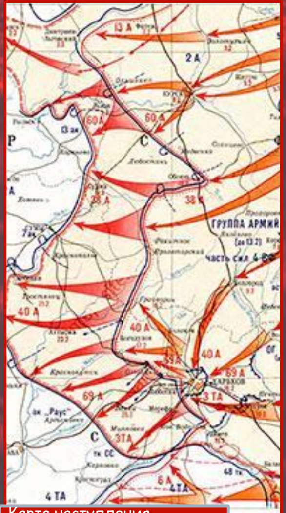
Карта наступления советских войск в январе - феврале 1943 года