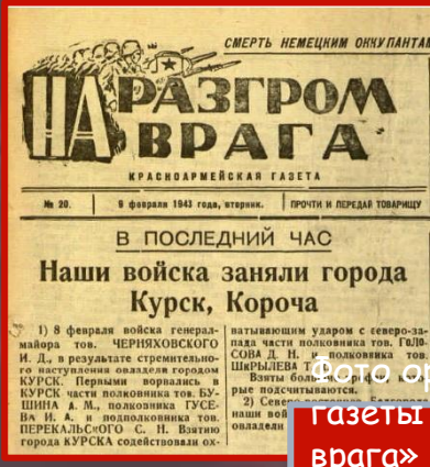
Фото оригинала газеты «На разгром врага» от 9 февраля 1943 г. с информацией об освобождении г. Курска