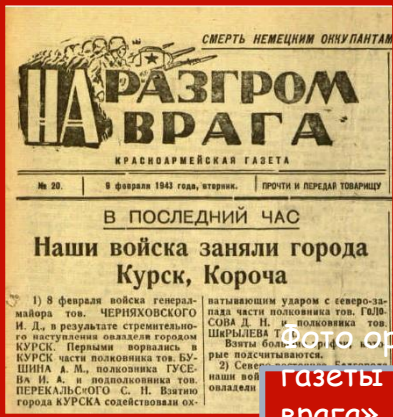
Фото оригинала газеты «На разгром врага» от 9 февраля 1943 г. с информацией об освобождении г. Курска