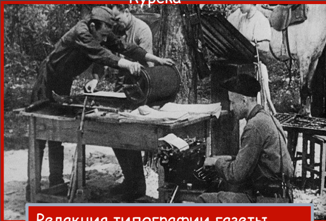
Редакция типографии газеты «Партизанская правда». Орловская область, 1942 г.

В таких непростых условиях производилась печать партизанских газет и листовок. Оборудование нередко поставляли из тыла, но краска и бумага очень ценилась в качестве трофеев.