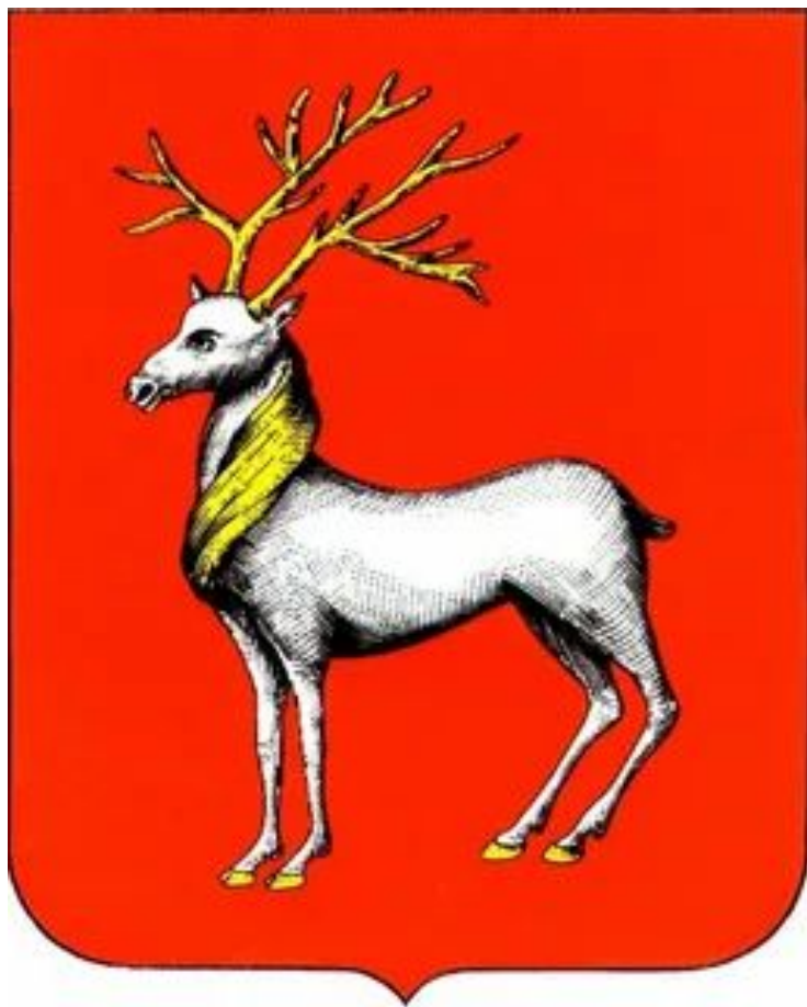
Герб Ростова Великого