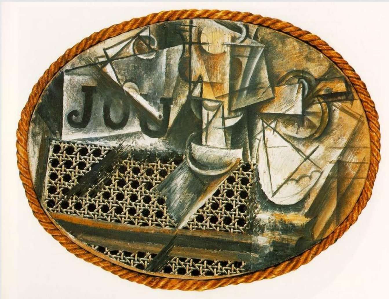
Пабло Пикассо «Натюрморт с плетеным стулом»