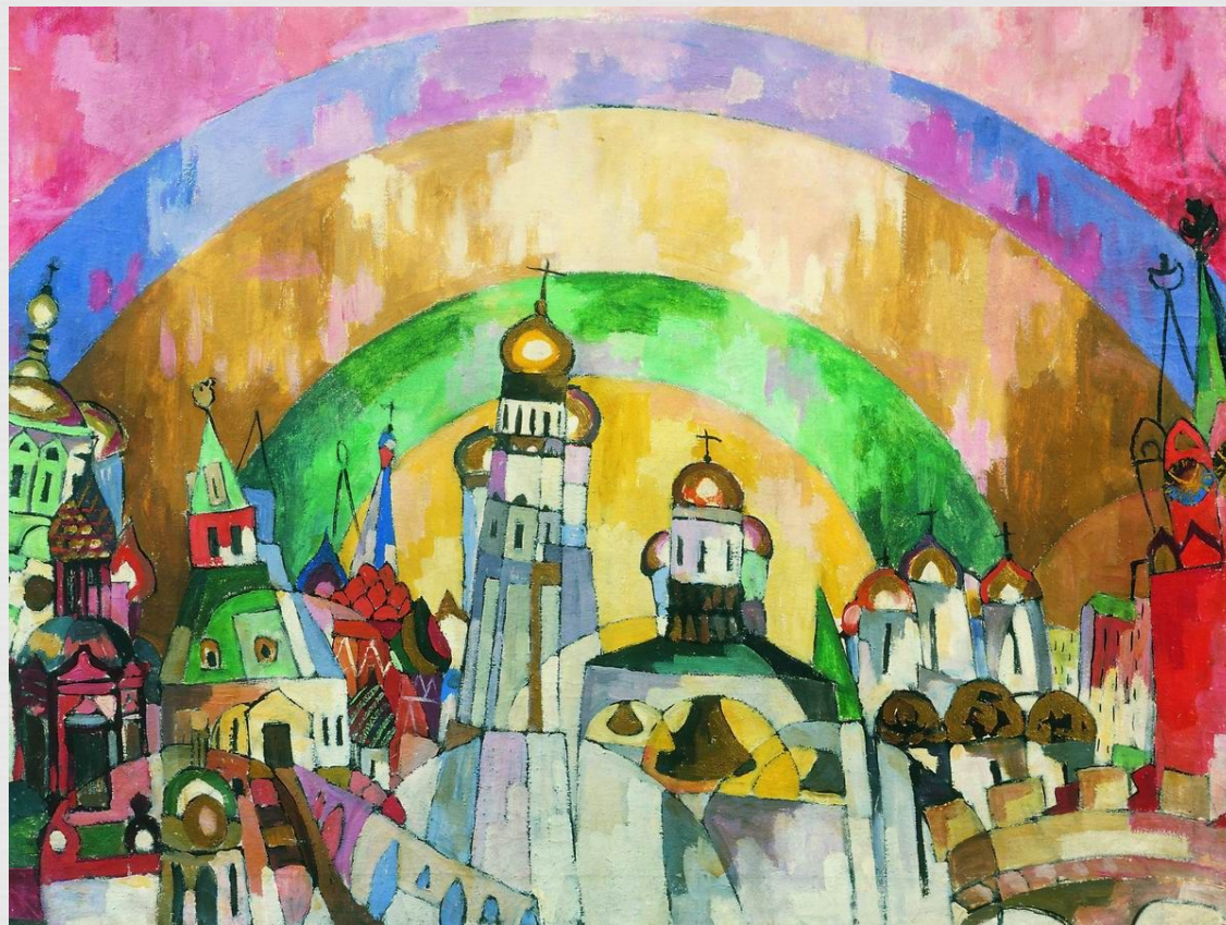
Панно «Москва», 1914г.

В русском искусстве первым, кто стал применять технику коллажа, был Аристарх Лентулов . Он сочетал в своих полотнах живописные фрагменты с наклеенными кусочками фольги и цветной бумаги.