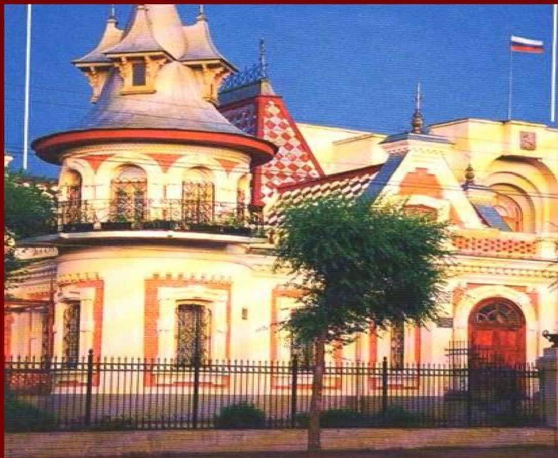
Особняк инженера Клодта