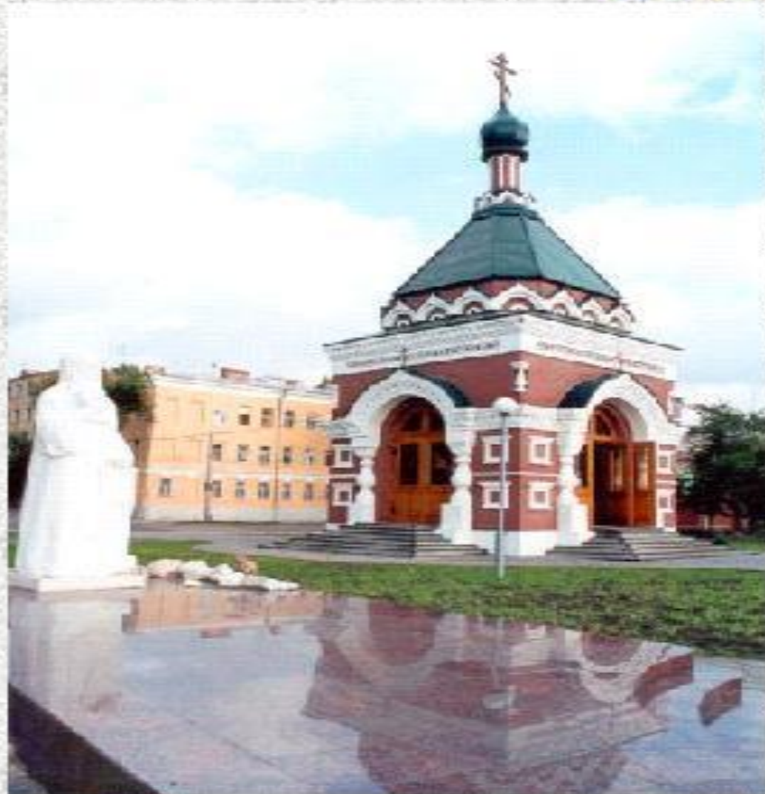
Часовня св. Алексия, ул. Горького

Духовным покровителем города считается Митрополит Московский и всея Руси святой Алексий. Святой Алексий — наставник и друг преподобного Сергия Радонежского, один из вдохновителей Куликовской победы, воспитатель Великого князя Дмитрия Донского. По преданию, 6 августа 1357 года на пути в Золотую Орду св. Алексий останавливался на ночлег в скиту монаха-отшельника у Самарского урочища (недалеко от будущей крепости), где предсказал основание города и предрёк ему большое будущее.