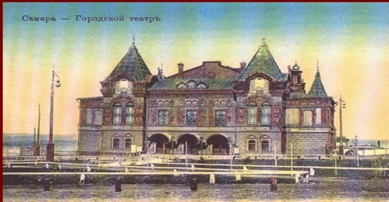
Самара — Городской театр