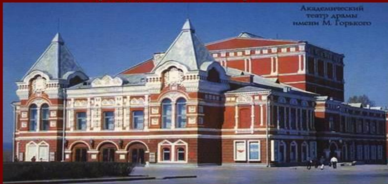
Академический театр драмы имени М. Горького