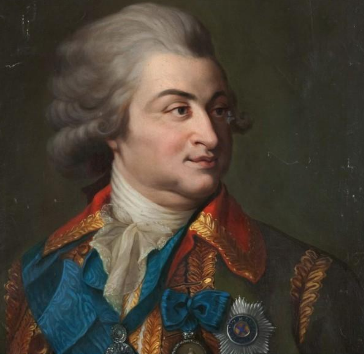
Вице-президент военной коллегии князь Г.А. Потемкин