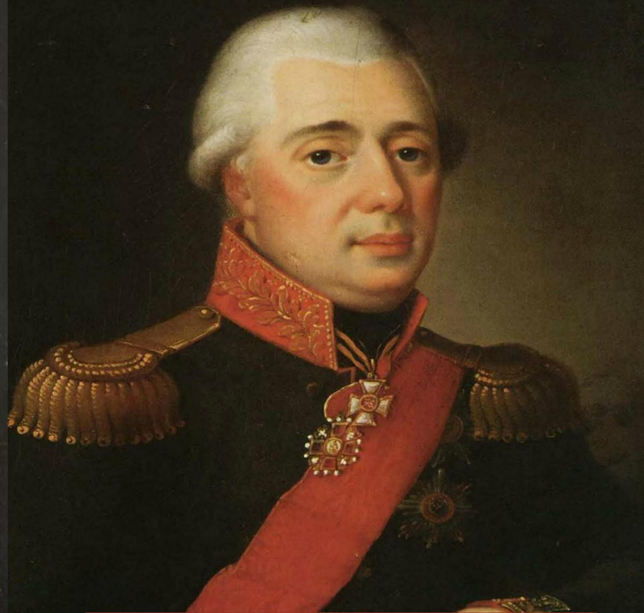
Астраханский губернатор И.В. Якоби