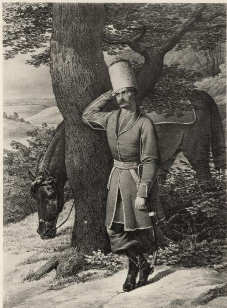
ВОЛГСКИЙ КАЗАКЪ 1774 года.

Екатерининская, Павловская, Мариинская, Георгиевская, Андреевская крепости