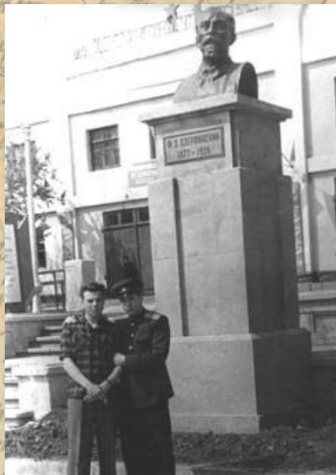
Памятник Ф.Э. Дзержинскому. Фото 1937 года

В честь революционера, советского государственного деятеля Феликса Эдмундовича Дзержинского. Памятник Дзержинскому представляет собой бронзовый бюст, который установлен 25 июля 1937 года на постаменте из гранитных плит розового цвета. Первый бюст был отлит в Москве. Скульптор — Яковлев. Высота бюста — 1 метр 20 сантиметров.