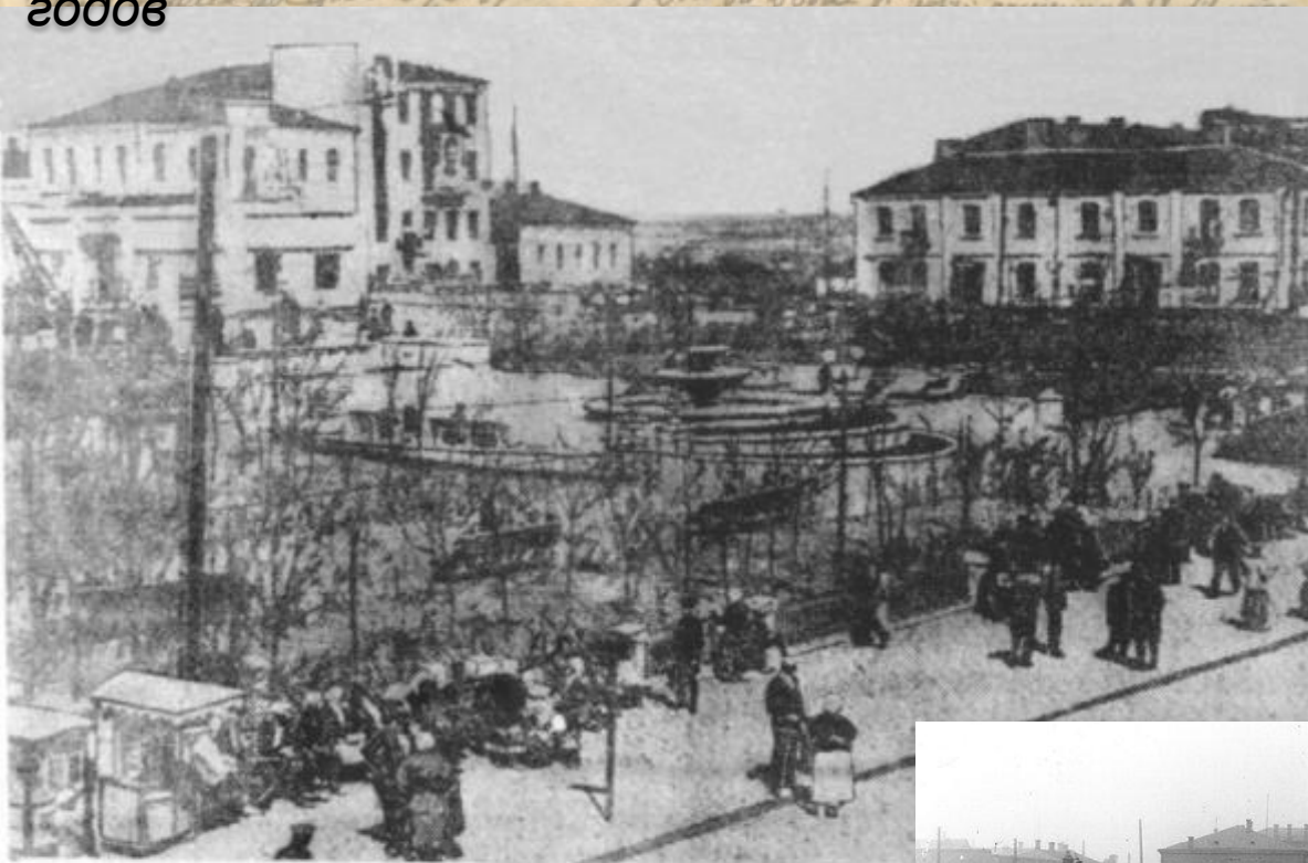
Скаер на площади им. Дзержинского.