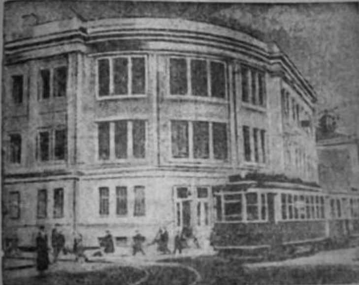
В год Сталино, рядом с Донецким медицинским институтом, строится здание Фельдшерско-акушерской школы. Первая очередь (2) введена уже в эксплуатацию. Вторая очередь (1) введена в эксплуатацию в XXI рождение Октября. На снимке: новое здание Фельдшерско-акушерской школы.