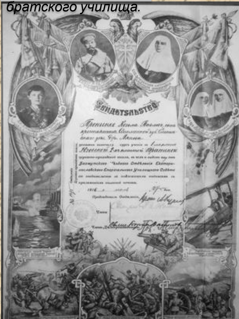
Свидетельство об окончании Юзовской двухклассной братской церковно-приходской школы. 1916 г.