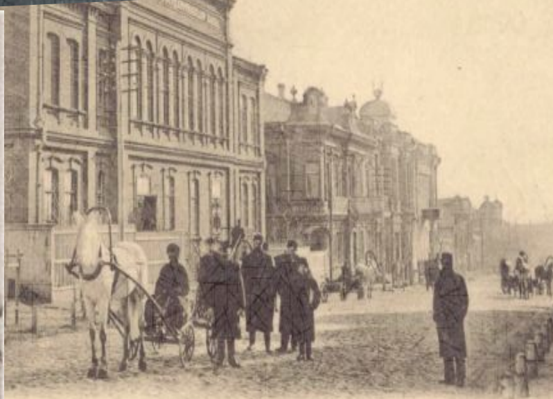
Отдѣл. Госуд. Банка. Succursale de la Banque d'Etat.