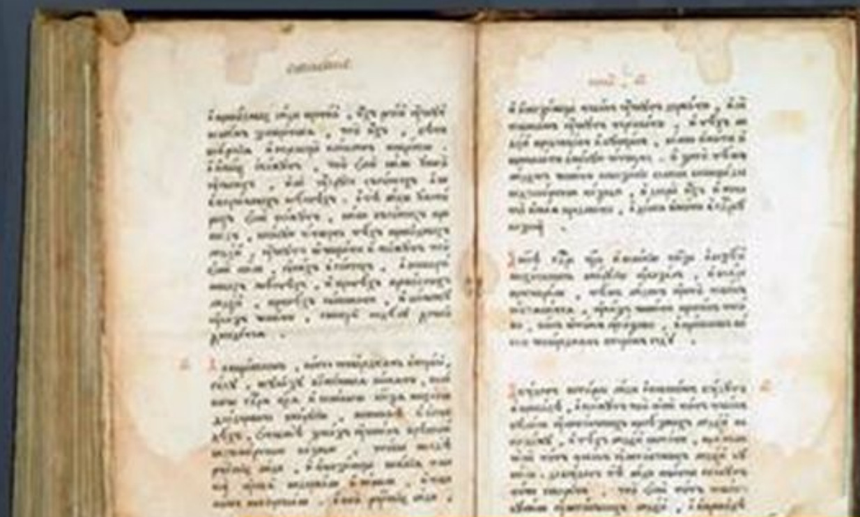
Соборное уложение 1649 г. Глава XXV. Указ о корчмах

...А за многие приводы у таких людей пороти ноздри и носы резати, а после пыток и наказанья ссылати в дальние города... чтоб на то смотря иным так не повадно было делать.