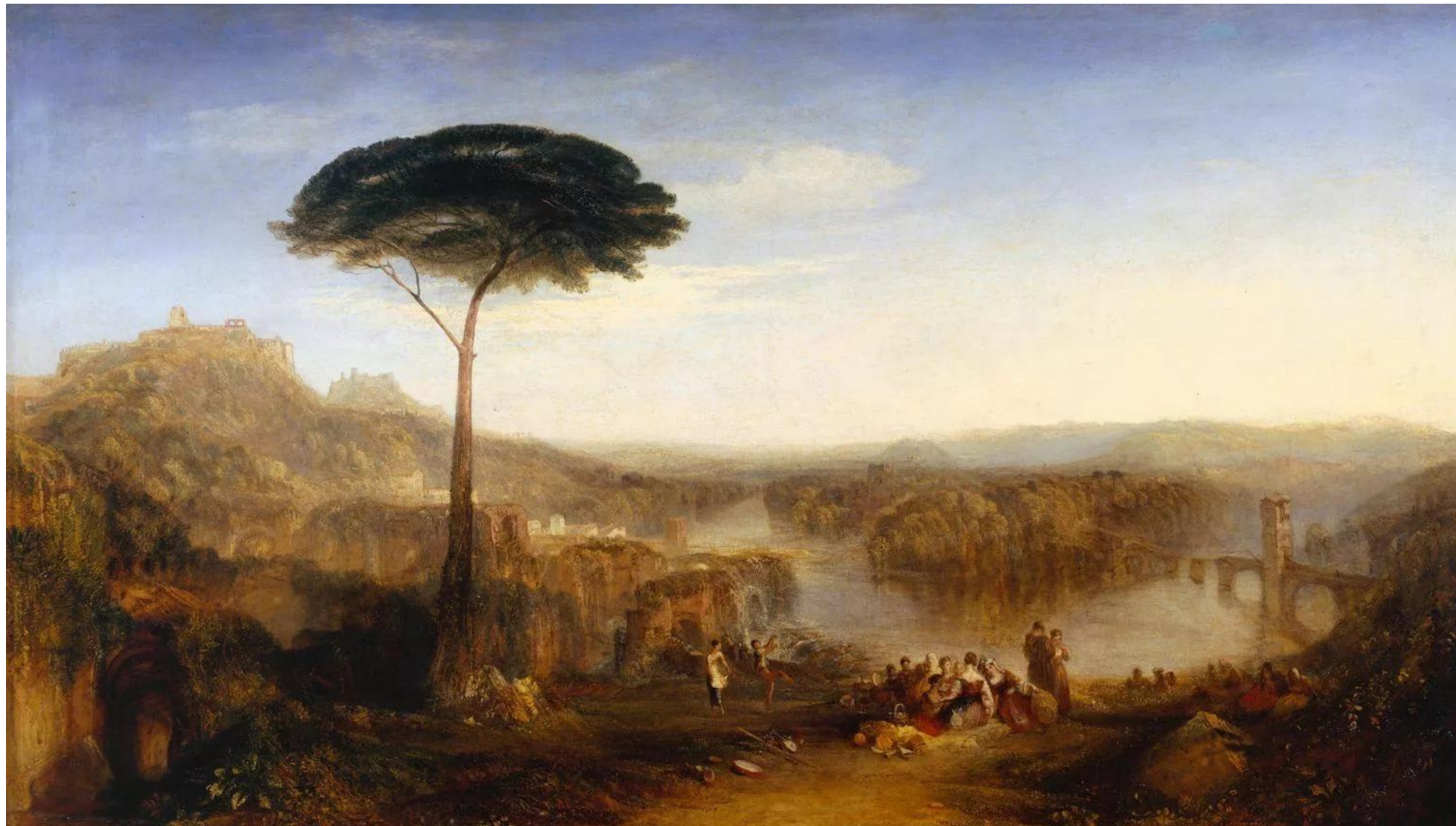
Уильям Тёрнер «Паломничество Чайлда Гарольда» Италия, 1832 год

1 часть «Гарольд в горах. Сцены меланхолии, счастья и радости» состоит из двух больших разделов: Adagio (g-moll) и Allegro (G-dur) – контраст чувств.