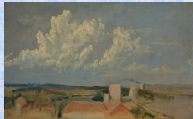
Иванов Александр Андреевич Облака над побережьем вторая половина 1830-х - 1840-е Бумага на картоне, масло