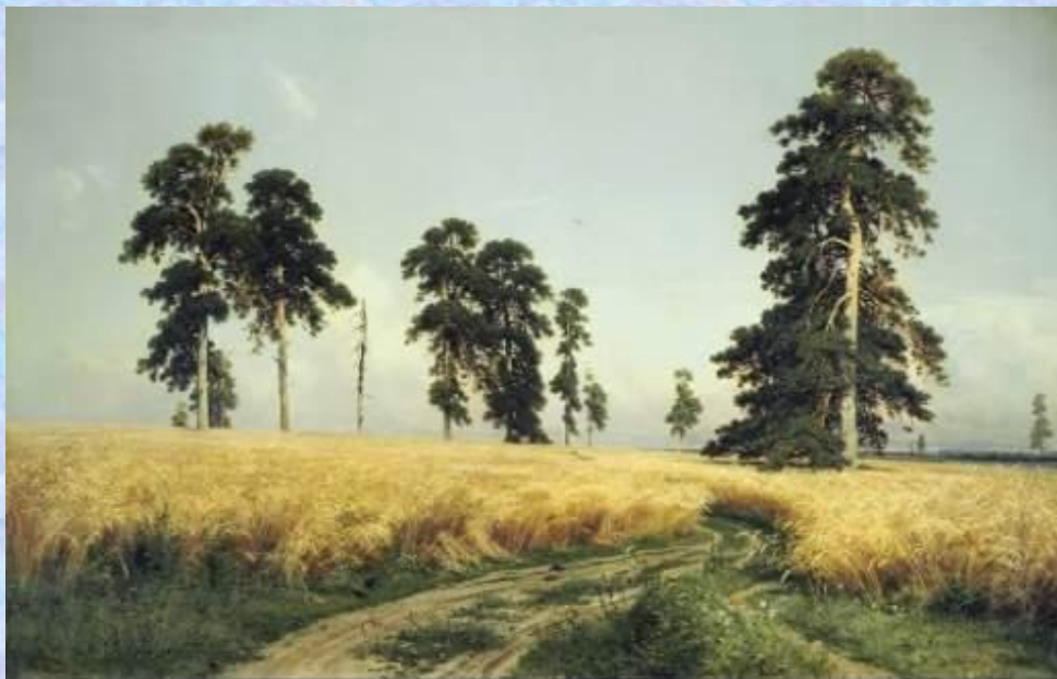
Шишкин Иван Иванович Рожь 1878