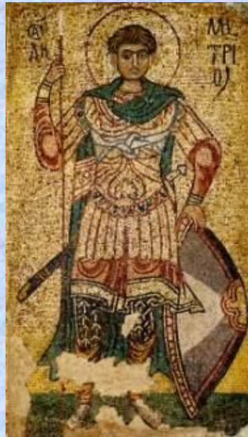
Неизвестный автор Дмитрий Солунский. Мозаика 1108-1113