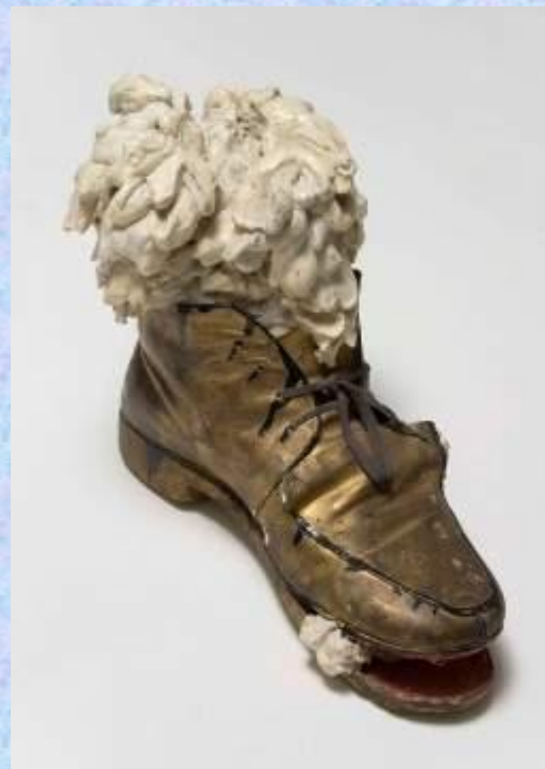
Пригов Дмитрий Александрович Ботинок 1973