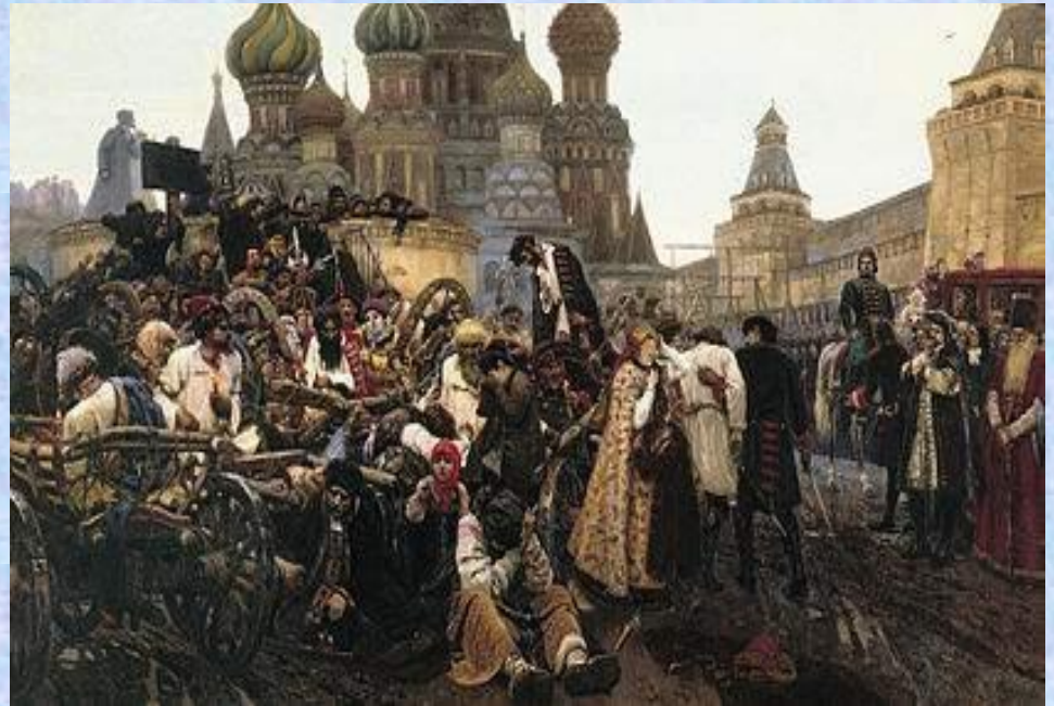
Василий Иванович Суриков Утро стрелецкой казни. 1881