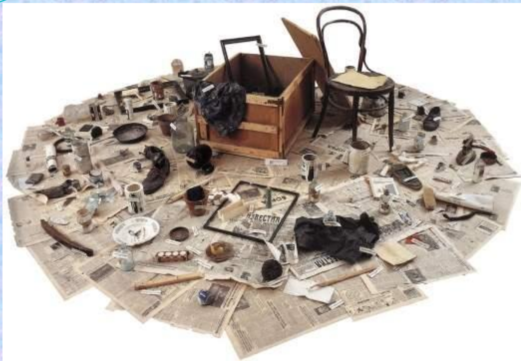
Кабаков Илья Иосифович Ящик с мусором 1981