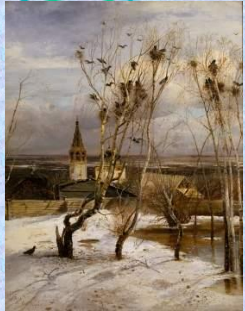
Алексей Кондратьевич Саврасов Грачи прилетели 1871