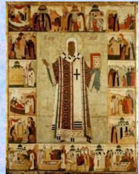
Дионисий Алексий митрополит Конец XV - начало XVI вв.