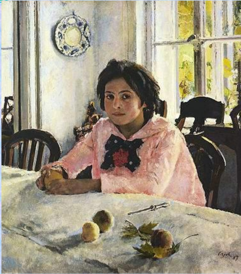
Валентин Александрович Серов Девочка с персиками 1887