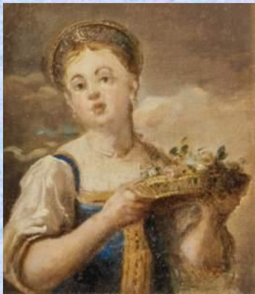
Тропинин Василий Андреевич Девушка в голубом сарафане, с корзиной цветов 1810-е Картон, масло