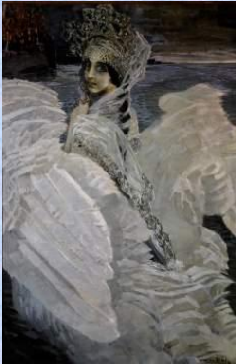
Врубель Михаил Александрович Царевна-Лебедь 1900

В галерее полно и разносторонне представлено искусство XX века полотнами таких художников, как М. Врубель, К. Малевич, М. Шагал.