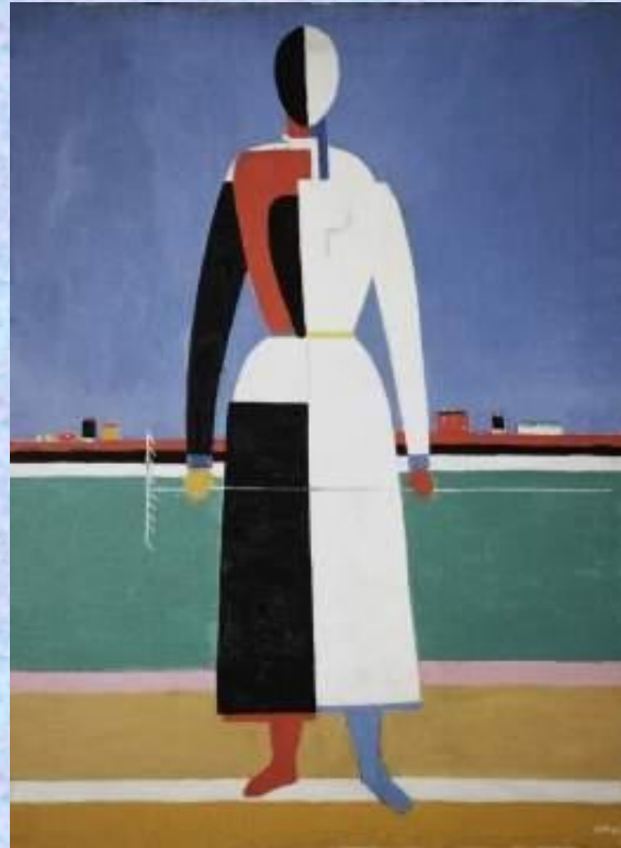
Малевич Казимир Северинович Женщина с граблями 1930-1931