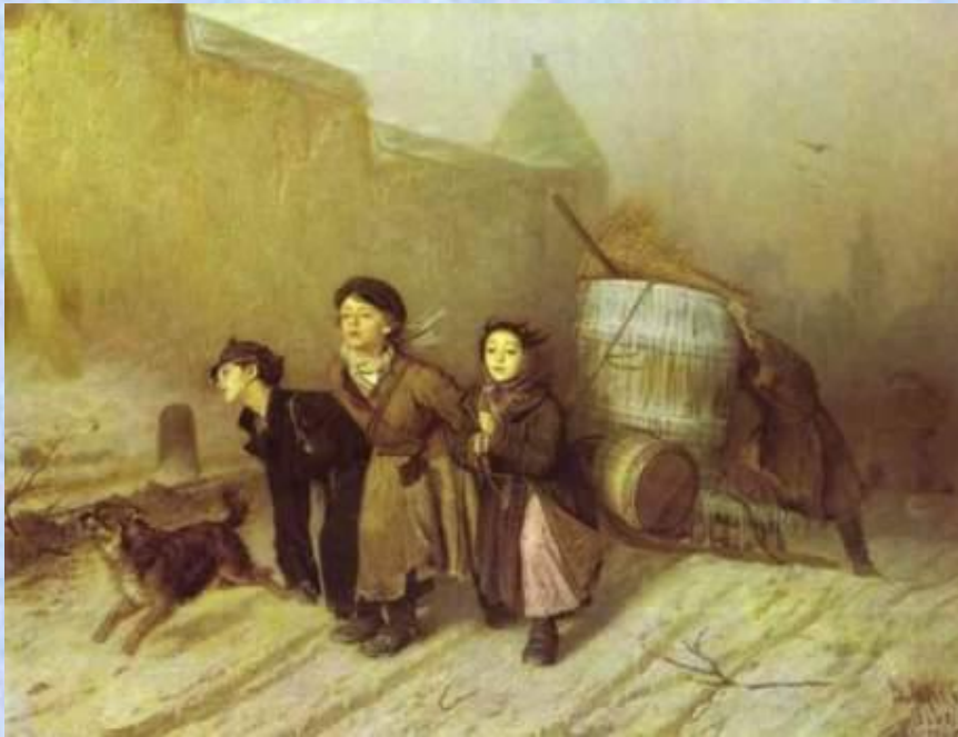
Василий Григорьевич Перов Тройка. Ученики мастеровые везут воду. 1866

Наиболее прославленная и самая полная коллекция русской живописи второй половины XIX века – картины В. Перова, В. Сурикова, В. Серова, пейзажистов – А. Саврасова, И. Шишкина, И. Левитана и многих, многих других.