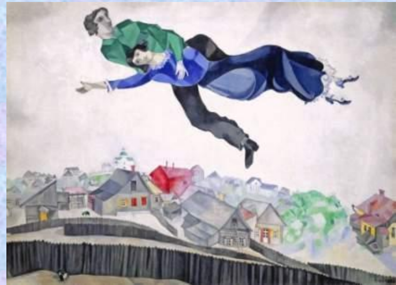
Шагал Марк Захарович Над городом 1914-1918