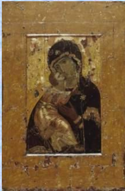
Неизвестный иконописец Богоматерь Владимирская Первая треть XII века