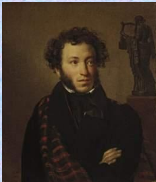
Кипренский Орест Адамович Портрет А.С.Пушкина 1827 Холст, масло