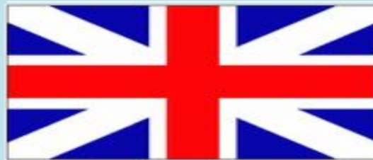
Original Union Flag (1606)