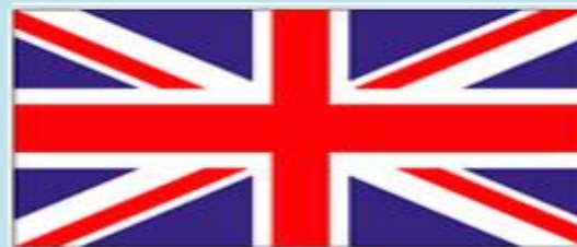
Current Union Flag (1801)