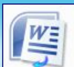
Microsoft Office Word