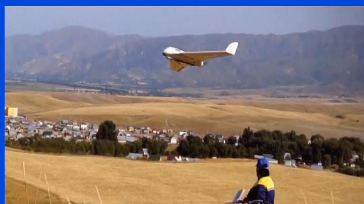
ДОСТАВКА ГАЗЕТ И ЖУРНАЛОВ АВИАМИ