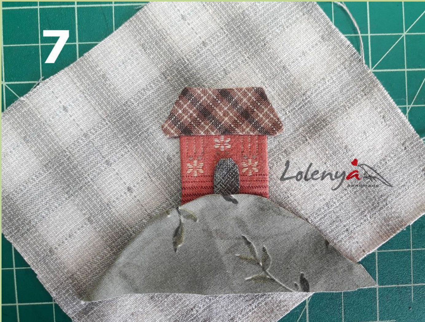
Фото 7. Далее убираю бумагу для заморозки, она снимается легко никакого следа на ткани не оставляет.