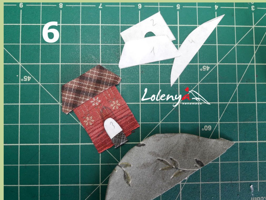
Фото 5,6. Подворачиваю припуск, прижимаю. Соединяю детали между собой, так же при помощи клея, наносите совсем чуть-чуть, для легкого сцепления. Если намазать сильно, клей высохнет, сильно сцепится и будет трудно пришивать