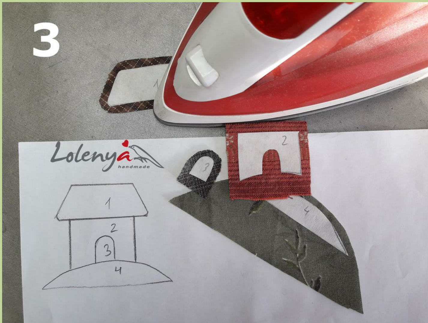
Фото 3. Вырезаю и при помощи нагретого утюга прикрепляю к лицевой стороне ткани бумагу для заморозки.