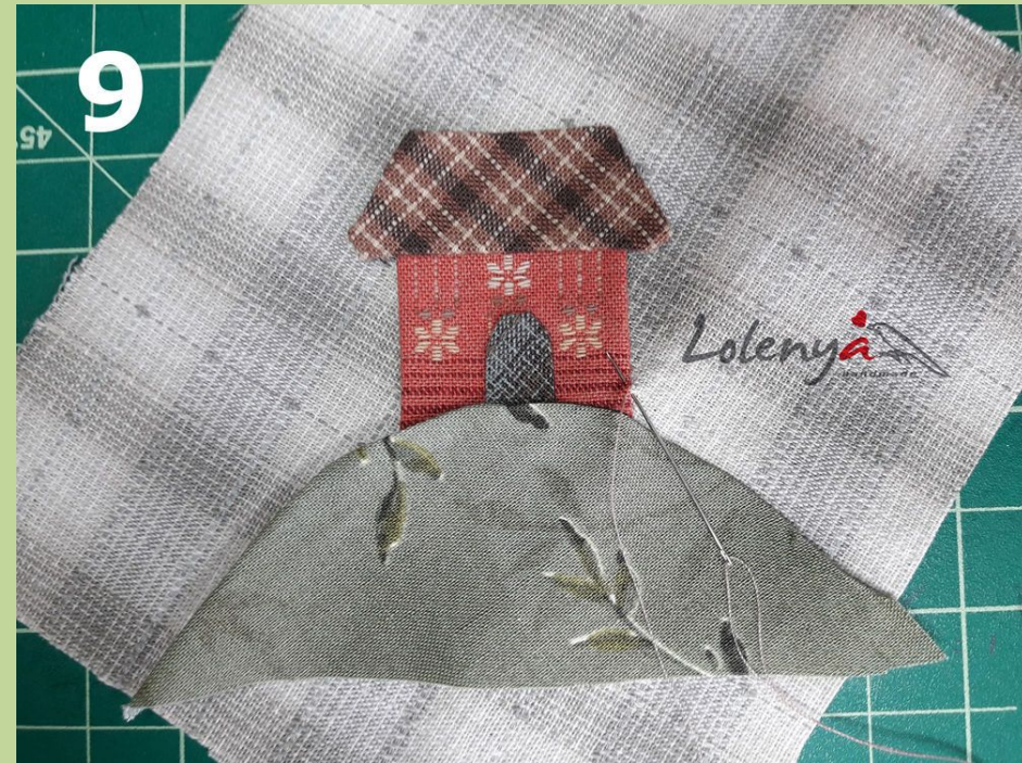
Фото 8,9. Пришивание. Для себя я выбрала нитки Мадейра Madeira Aerofil 120, иголки bohin 11 или 12 размер. Пришиваю детали маленькими стежками, длина примерно 1 мм, через край, на расстоянии друг от друга, примерно 2 мм, можно и реже делать стежки, в зависимости от работы. Например, если деталь большая в крупном панно.