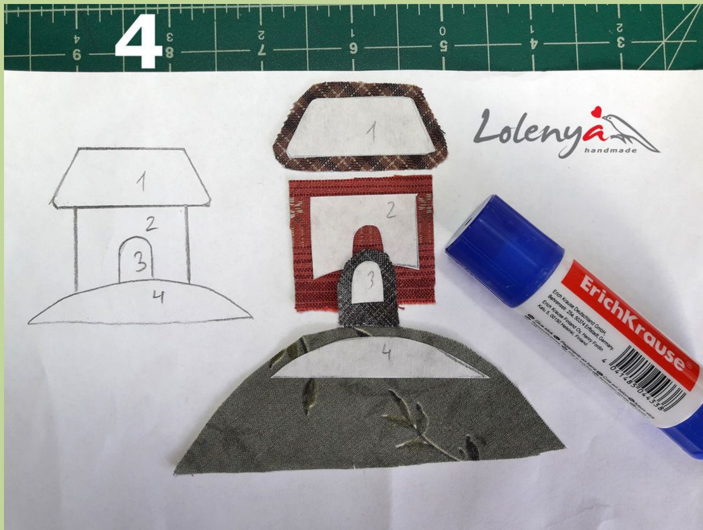
Фото 4. Вырезаю детали с припуском и наношу клей на самый край детали, чуть-чуть. Подойдёт любой водорастворимый клей карандаш.