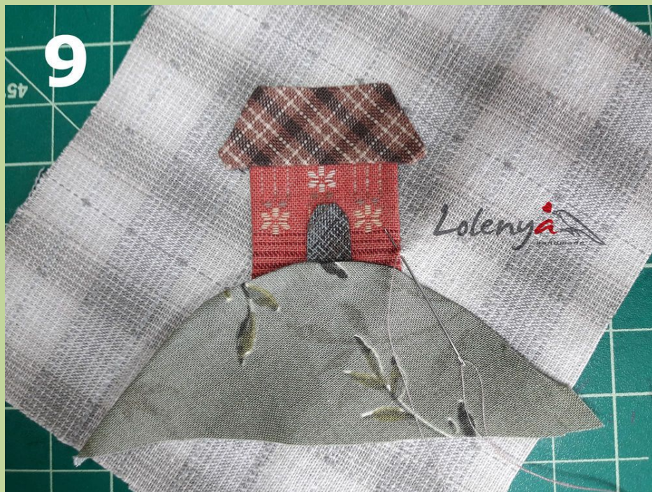
Фото 8,9. Пришивание. Для себя я выбрала нитки Мадейра Madeira Aerofil 120, иголки bohin 11 или 12 размер. Пришиваю детали маленькими стежками, длина примерно 1 мм, через край, на расстоянии друг от друга, примерно 2 мм, можно и реже делать стежки, в зависимости от работы. Например, если деталь большая в крупном панно.