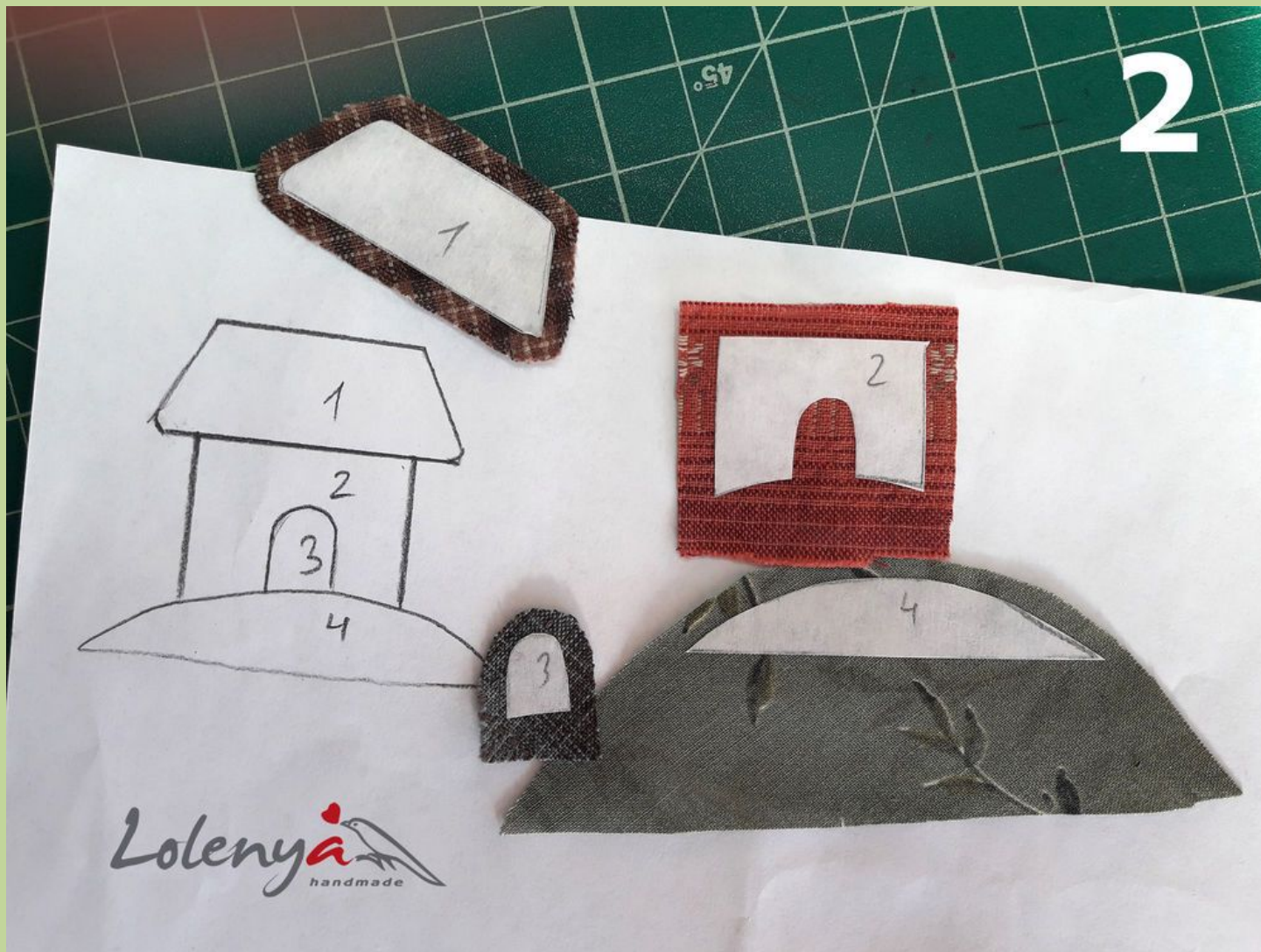
Фото 2. Рисую на матовой стороне. Нумерую детали